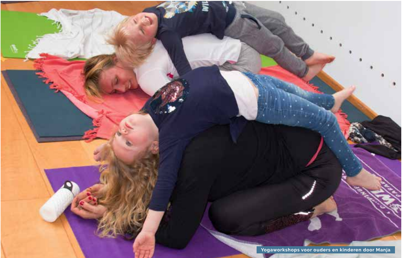
Yogaworkshops voor ouders en kinderen door Manja

tekst: Hanneke de Reus