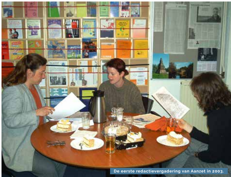
De eerste redactievergadering van Aanzet in 2003.