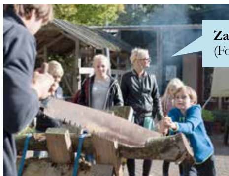
Zagen bij de Tafelboom

Zondag 8 oktober zwaaiden op Rotsoord de deuren open van allerlei bedrijven en initiatieven om te tonen wat dit stukje stad aan de Vaartse Rijn allemaal te bieden heeft. Het was druk en gezellig, geholpen door het zonnige weer.