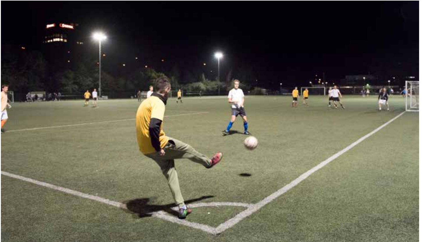
Footy organiseert voetbalcompetities zonder verplichtingen.

Eind vorig jaar werd duidelijk dat VV Hoograven ging stoppen. Na het vertrek van voorzitter Paul Verweel lukte het zijn opvolger niet om de club in rustig vaarwater te krijgen. Vervolgens stond de accommodatie leeg totdat begin september de nieuwe huurder Footy zijn deuren opende.