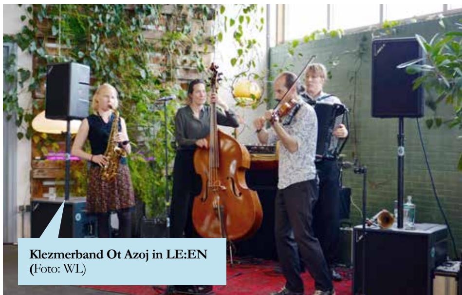
Klezmerband Ot Azoj in LE:EN