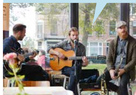
Pierre et les Optimistes in Camping Ganspoort.

De initiatiefnemers en de deelnemende ondernemers zijn erg tevreden over de proeftuin, in april staat alweer een nieuw festival gepland. (MvE)