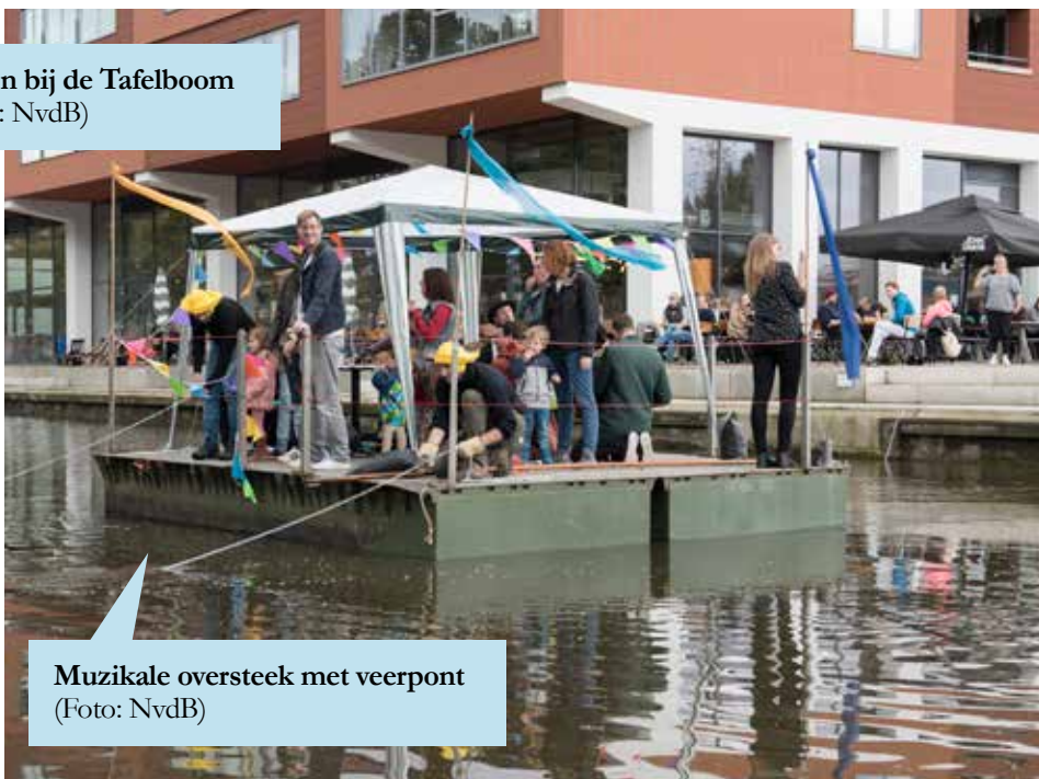
Muzikale oversteek met veerpont

Zondag 8 oktober zwaaiden op Rotsoord de deuren open van allerlei bedrijven en initiatieven om te tonen wat dit stukje stad aan de Vaartse Rijn allemaal te bieden heeft. Het was druk en gezellig, geholpen door het zonnige weer.