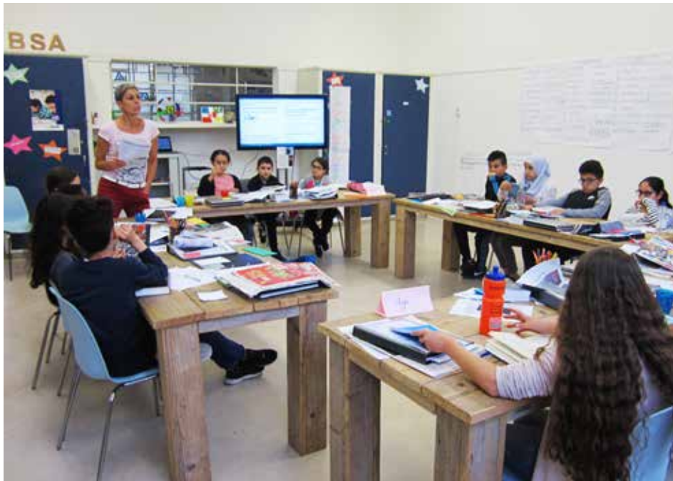
Op de BSA kunnen kinderen veel bijleren.

Op de Verlengde Hoogravenseweg, in het voormalig UCK-gebouw, komen elke week leerlingen van groep 6, 7 en 8 na school samen op de Brede School Academie (BSA) om nog meer te leren dan zij op de basisschool al doen. Sinds dit schooljaar een keer per week van 15.00 tot 18.00 uur.