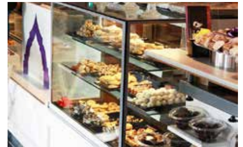
Veel keuze bij Fata Morgana.

Toen de panden van Andalous en Stellaard vrijkwamen, tipte een kennis uit de bakkerijwereld El Abouti. Hij zei: 'Je moet een Nederlandse en een Marokkaanse bakkerij naast elkaar openen.' Maar El Abouti antwoordde: 'Dat ga ik niet doen.' In plaats daarvan wilde hij één winkel waar iedereen zich thuis voelt, een bakkerij van deze tijd. De kennis zag onlangs de mooi ingerichte zaak en merkte op: 'Nu begrijp ik wat je bedoelt.'