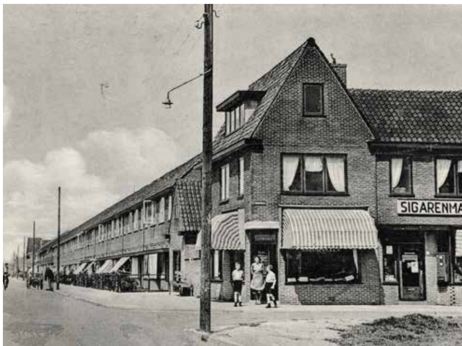
Sigarenmagazijn L.G. Stuivenberg hoek Verlengde Hoogravenseweg - Rondweg.

“Bijna iedereen die tussen 1930 en 1970 in onze wijken woonde deed zijn boodschappen om de hoek of kreeg de winkelier aan de deur”. Dat staat in de aankondiging van de huidige expositie van de Stichting Historische Kring Tolsteeg Hoograven (HKTH) in de bibliotheek aan het Smaragdplein. De expositie, die is te zien tot en met 1 april, laat het rijk gedocumenteerde verhaal zien van de opkomst en ondergang van de middenstand in onze wijken.