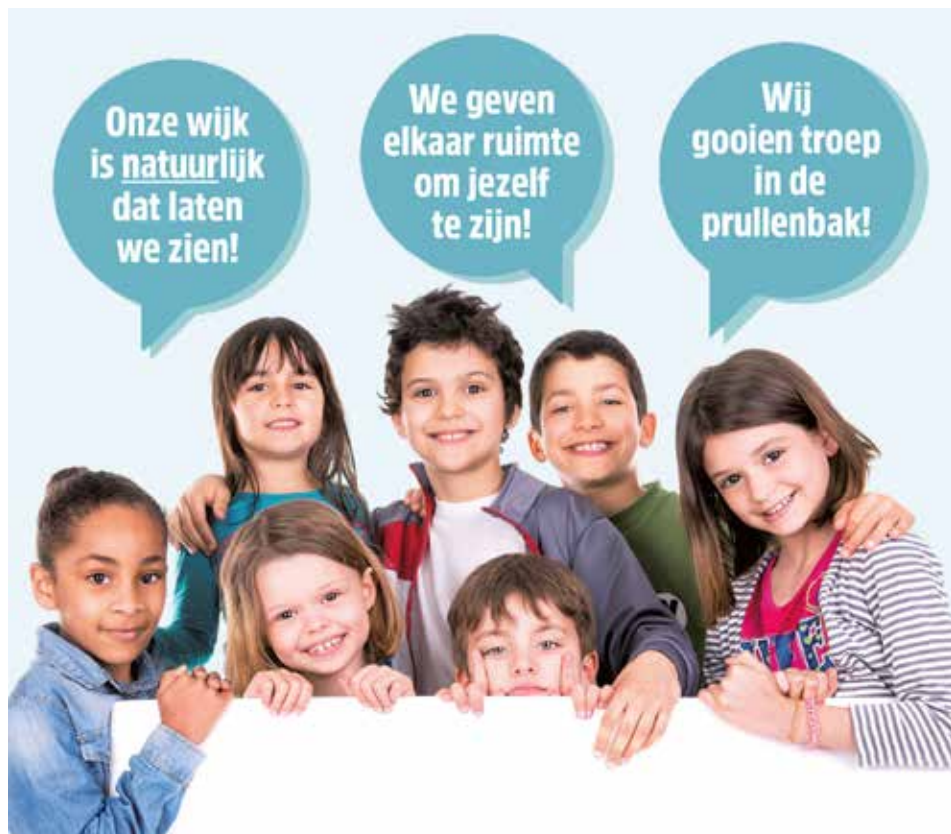
De Vreedzame Kinderraad wil een prettige en veilige wijk.

Kinderen uit Hoograven willen een prettige, schone, natuurlijke en veilige wijk om in te wonen. Daarom hebben ze de krachten gebundeld.