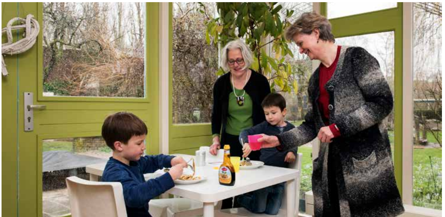
Pannenkoekenmiddag op woensdag in Nieuw Rotsoord.

Wijkbewoners die op zaterdag kinderboerderij Nieuw Rotsoord willen bezoeken staan al drie maanden voor een gesloten hek. Er zijn te weinig vrijwilligers om bezoekers in het drukke weekend te ontvangen. Er worden dan ook dringend vrijwilligers gezocht voor het theehuis en de dierenverzorging. Vrijwilligers hoeven niet iedere week te komen, maar zo vaak als ze kunnen.