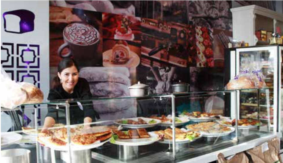
Fata Morgana: 'Een bakkerij van deze tijd'.

Op 2 februari 2017 opende bakkerij Fata Morgana aan de 't Goylaan 66c/d. De komst van de zaak in winkelcentrum Hart van Hoograven stond al maanden aangekondigd. De aannemer moest eerst de basisvoorzieningen in het dubbele winkelpand in orde maken. Nu kunnen buurtbewoners genieten van lekkernijen uit verschillende culturen.