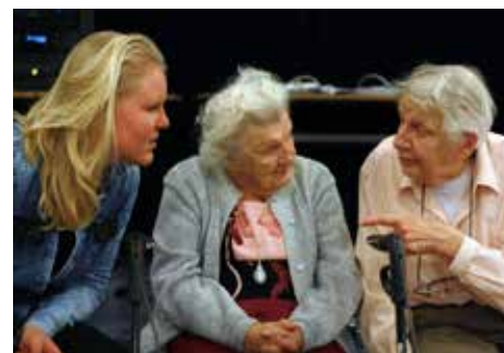
Bewoners in gesprek.