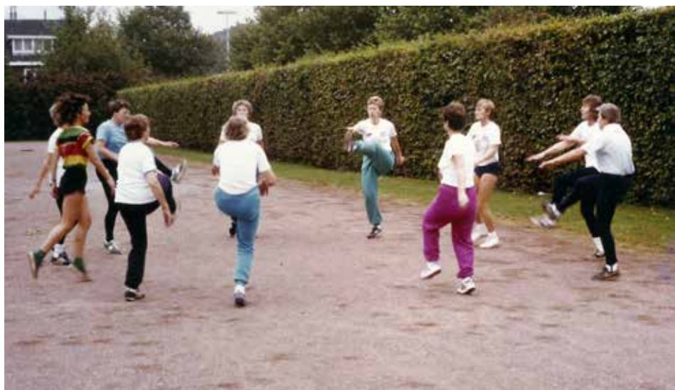
Sporten in 1986!

Begin jaren 70 was het 'trimmen' erg populair. Ook de media besteedde daar veel aandacht aan. Bij de atletiekvereniging Hellas werd daarvoor een speciale afdeling 'recreatiesport' in het leven geroepen. Doel was om in alle wijken van Utrecht trimgroepen op te richten, zodat mensen in eigen omgeving recreatief konden sporten. Daarvoor werden