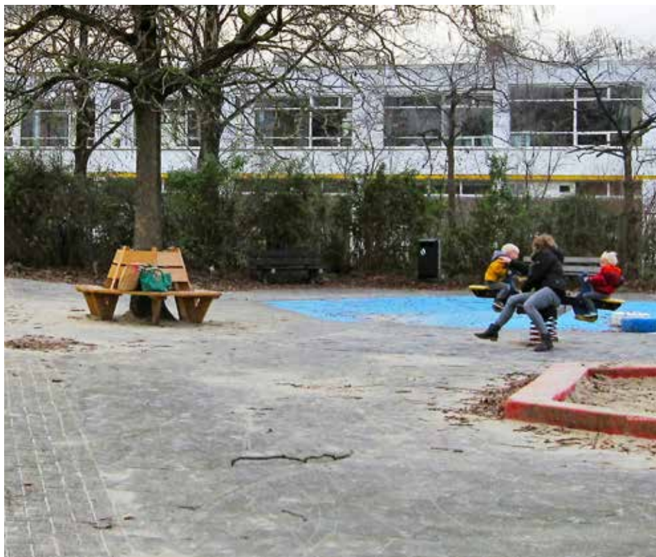
Een voorbeeld van bewonersinitiatief: de Boombank bij speeltuin 't Raafje.

De gemeente vindt het belangrijk dat bewoners zelf het initiatief nemen om hun wijk te verbeteren. En heeft geld beschikbaar om daar mee te helpen. In het verleden heette dat het leefbaarheidsbudget, nu is de naam veranderd in het Initiatievenfonds. Maar is er meer veranderd dan alleen de naam?