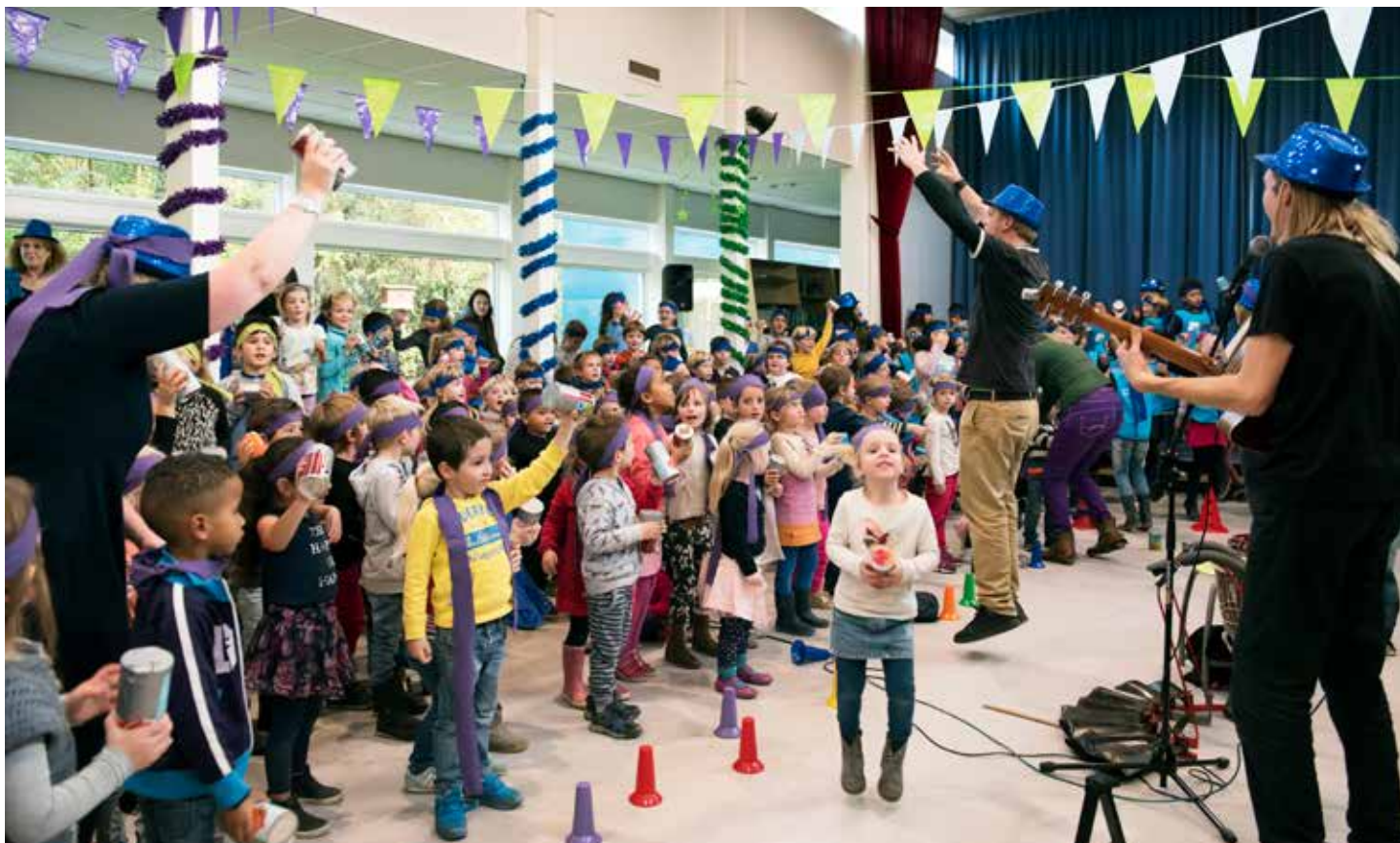
Waar is dat feestje?

Vrijdag 11 november vierde buurtbasisschool de Blauwe Aventurijn dat vijf jaar geleden officieel het nieuwe gebouw geopend werd. De hele dag waren alle kinderen en leerkrachten, onder begeleiding van het 'Fort van de Verbeelding', samen actief met dans en muziek. Een spetterende voorstelling werd in de middag gepresenteerd aan ouders en andere belangstellenden, die ook actief werden betrokken bij het muzikale spektakel. Eind van de middag was er een lampionnenopocht door de wijk.