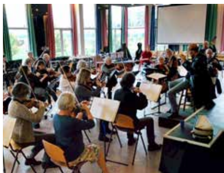
Orkest Vuso.

Huize Tolsteeg aan de Saffierlaan is tegenwoordig De Saffier. Het gebouw is niet alleen een woonflat, maar ook deels een wijkcentrum. Nu de verbouwing klaar is, gaan de diverse vaste activiteiten, zoals dansles, zangkoor, bridge, yoga, tai chi, sjoelclub, mandala tekenen, zendamateurs, orkest Vuso, de dansavond en de Huiskamer van de Wijk samen door binnen een nieuw samenwerkingsverband. Restaurant 't Tolsteegje naast de ingang is ook klaar. De koffie is er goed en de maaltijden overheerlijk. U kunt er dagelijks binnenlopen. De Saffier, met ver-