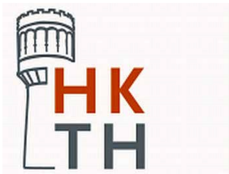
Logo St. Historische Kring Tolsteeg-Hoograven.

Het leefgebied Tolsteeg / Hoograven / Bokkenbuurt doet zijn naam eer aan: het is een waarachtig leefgebied, waar mensen graag wonen, werken, recreëren en verblijven. Het gaat dan ook probleemloos met zijn tijd mee. Dat is zo gegroeid.