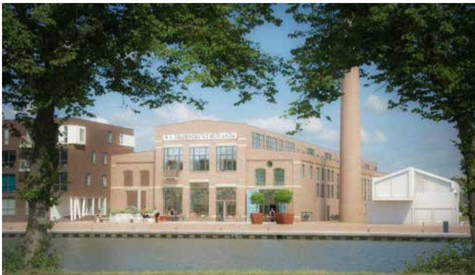
De oude fabriekshal gaat onderdak bieden aan horeca en appartementen

Binnenkort start de bouw van appartementen in de oude spijkerfabriek Neerlandia aan de Verlengde Hoogravenseweg. De muren van de fabriek blijven intact waardoor de nieuwe woningen de mooie, oude uitstraling behouden. In totaal komen er in de fabriek 66 huurappartementen. Verder komt er een horecagelegenheid.