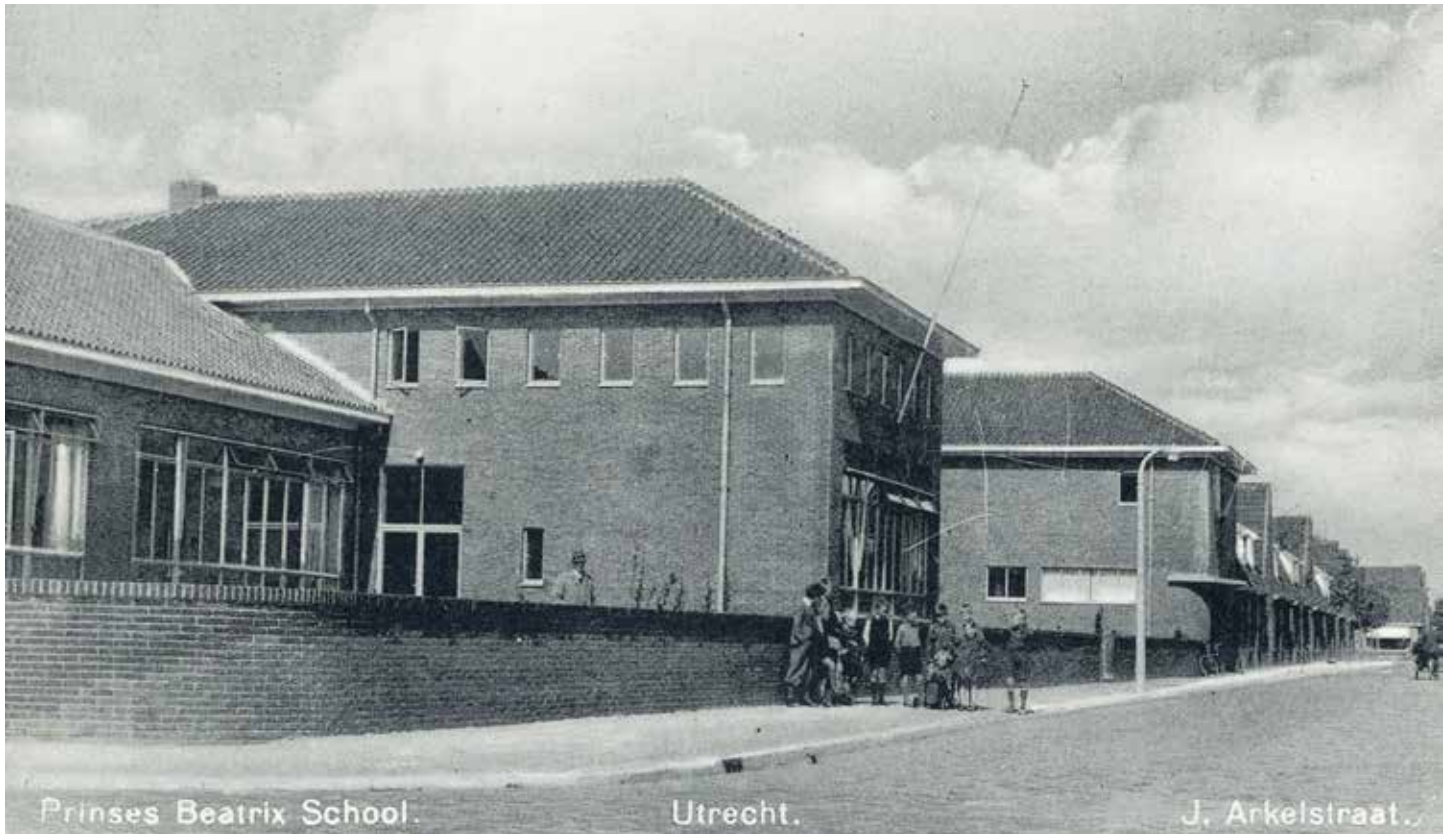
Gezicht op de Prinses Beatrixschool aan de Jan van Arkelstraat te Utrecht.

Op 1 juni 1939 waaide in de wijk Hoograven (toen nog Jutphaas) van vele huizen de groen-witte vlag. De Beatrixschool aan de Jan van Arkelstraat zou feestelijk worden geopend.