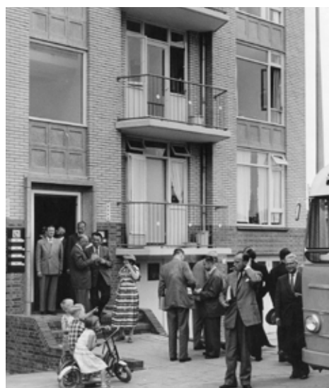
Beeld uit Het Utrechts Archief (Foto: HUA)