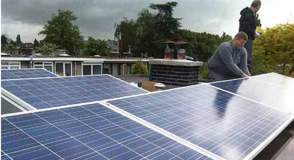
Zonnepanelen in de wijk.

Wij zijn bewoners van Hoograven die zich willen inzetten voor een duurzame wereld. We weten wat er in de buurt speelt en wat de mogelijkheden zijn. We worden ondersteund door de gemeente, enkele van onze leden zijn ook gemeentelijk Energie Ambassadeur.