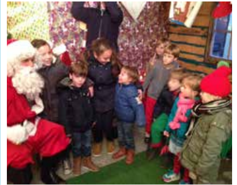
Kerstman in Speeltuin De Kameleon.