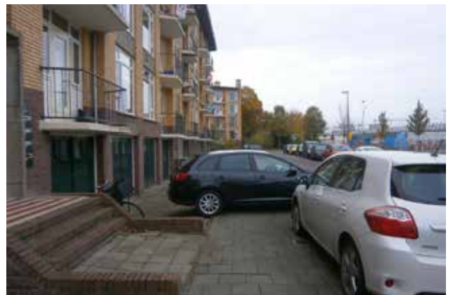
Parkeeroverlast in Tolsteeg. (HvD)

Ondertussen blijft het ten noorden van de Saffierlaan zoeken naar een parkeerplekje. Creatief wordt elke centimeter benut. Maar iedereen moet wel goed opletten hoe je de auto parkeert. Wanneer een auto verkeerd staat, zijn parkeerwachters onverbiddelijk en zij hebben aan sommige buurtgenoten al