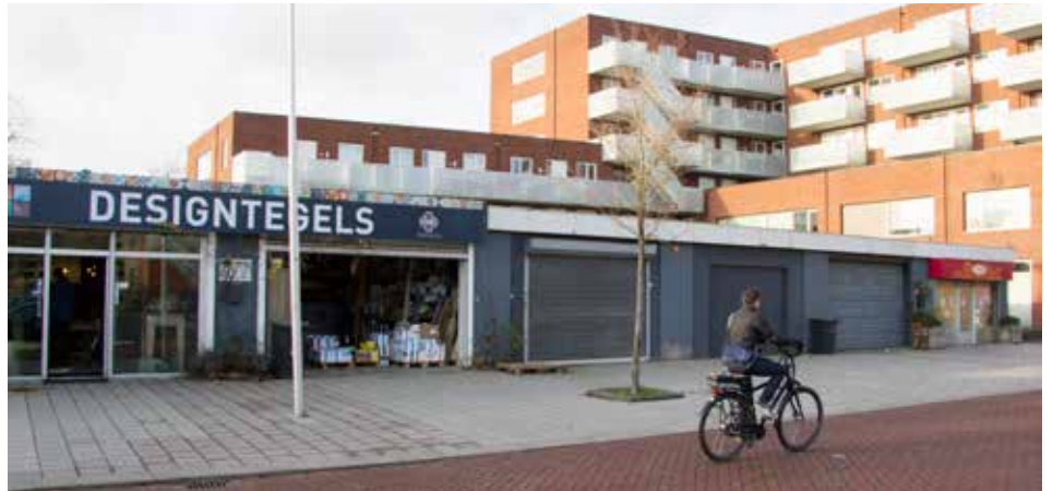
Garageboxen aan de Duurstedelaan.

Op woensdag 9 september organiseerde Dekkers een informatieavond voor buurtbewoners over de plannen voor het terrein. Er zullen woningen komen van ca. 125 m 2 , bestaande uit twee bouwlagen en een kap. De huizen worden gebouwd in de stijl van bestaande woningen aan de Duurstedelaan. De huidige garageboxen hebben een bedrijfsbestemming. Voor het nieuwe plan moet de