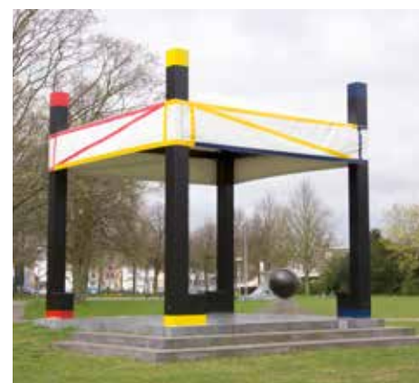
Muziektent Tolsteegplantsoen.

Er is een tijd van komen en er is een tijd van gaan. Dat geldt ook voor ons, na zeven jaar op een mooi plekje aan het Tolsteegplantsoen gewoond te hebben. Op zo'n moment kijk je om je heen en zie je dat er toch wat dingen veranderd zijn. Zeven jaar geleden stonden er nog mooie, grote kastan-jebomen langs het plantsoen. Helaas zijn deze vanwege een ziekte gekapt. Gelukkig doen de nieuwe bomen het ook goed.