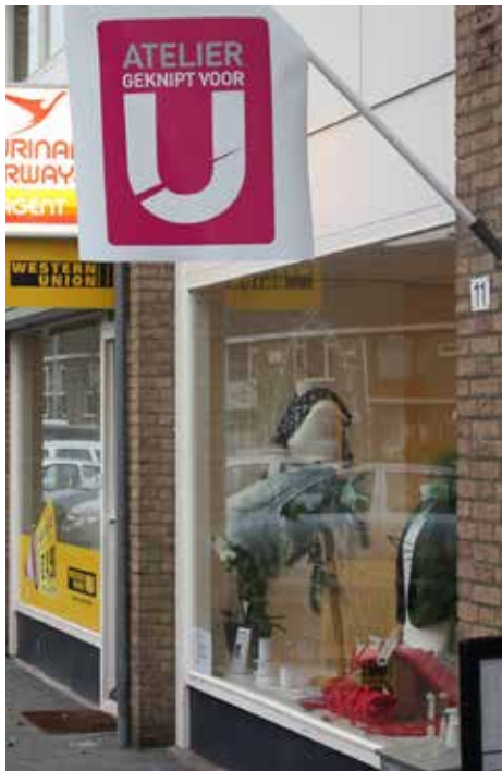
Naaiatelier 'Geknipt voor U'.