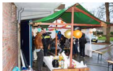
Er waren ook lekkere hapjes.

baarheid en sfeer in de buurt proberen te verhogen, door projecten te organiseren waar de buurt behoefte aan heeft'. Denk aan: ontmoetingsbijeenkomsten, bloembakken ophangen en huiskamerbijeenkomsten.