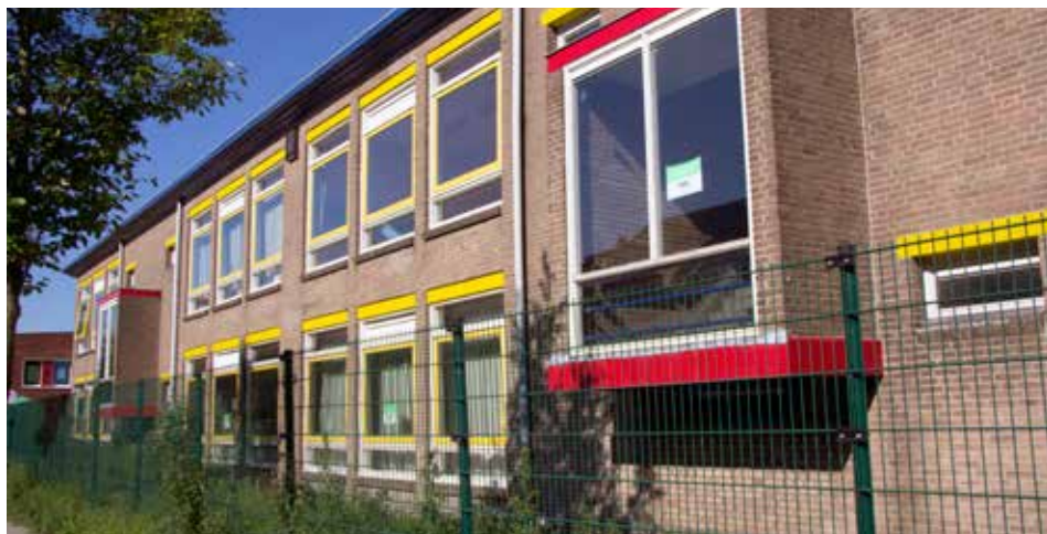
Het voormalige schoolgebouw van de Ariënschool blijft staan.

Ouders met kinderen op een van de scholen in Hoograven-Zuid zal het wel eens zijn opgevallen. Al vanaf 2011 staat het voormalige schoolgebouw van de Ariënschool leeg. Het idee was dat het architectonisch interessante gebouw een nieuwe functie zou krijgen. In 2012 is er een plan bedacht om de school door een aantal bewoners samen om te bouwen naar woningen en/of appartementen (als zgn. collectief opdrachtgever). Alle initiatiefnemers zouden daarin vervolgens hun eigen woning krijgen. Dit plan is echter nooit verder gekomen dan de tekentafel. De risico's van dit plan bleken te groot.