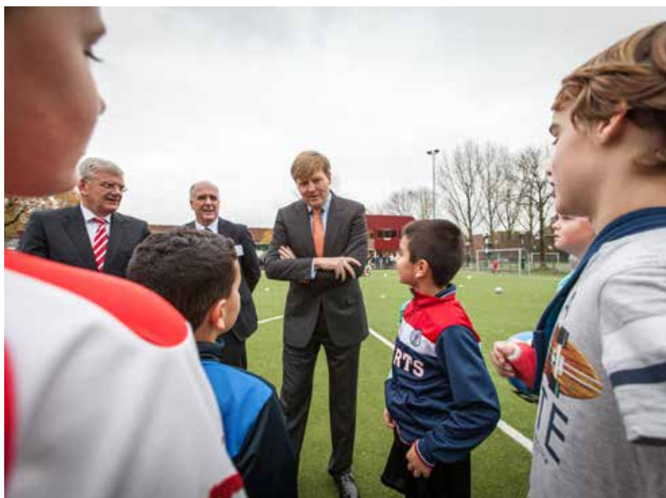
Voetballertjes in gesprek met koning Willem Alexander.