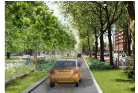
Impressie toekomstbeeld 't Goylaan.

Het college van burgemeester en wethouders is op 10 november akkoord gegaan met het definitief ontwerp voor de herinrichting van de 't Goylaan. Daarmee is de omvorming tot stadsboulevard een feit. Er liggen stapels berekeningen en simulaties ten grondslag aan het nieuwe ontwerp, toch zijn veel wijkbewoners nog sceptisch.