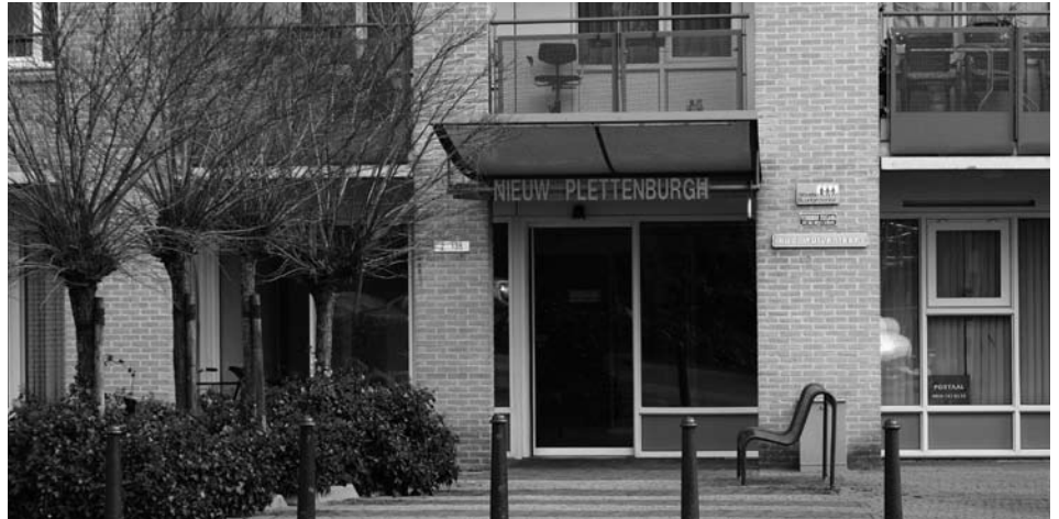
Woonzorgcentrum Nieuw Plettenburgh.

De Utrechtse verzorgingshuizen en Thuiszorgorganisatie Aveant hielden 15 maart open dag. Met informatiestands en versnaperingen werden de mensen naar binnen gelokt. Iedereen was welkom. Wat komt daar nou voor volk op af? Aanzet ging eens kijken.