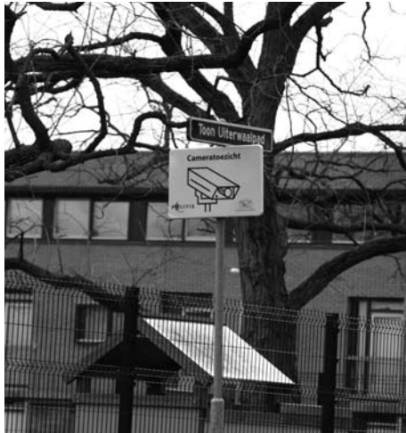
Inmiddels hangen er drie beveiligingscamera's in Hoograven Zuid.

De ouders van de raddraaiers krijgen binnenkort politie en gemeente over de vloer. Zonodig gaat de burgemeester zelf. Van