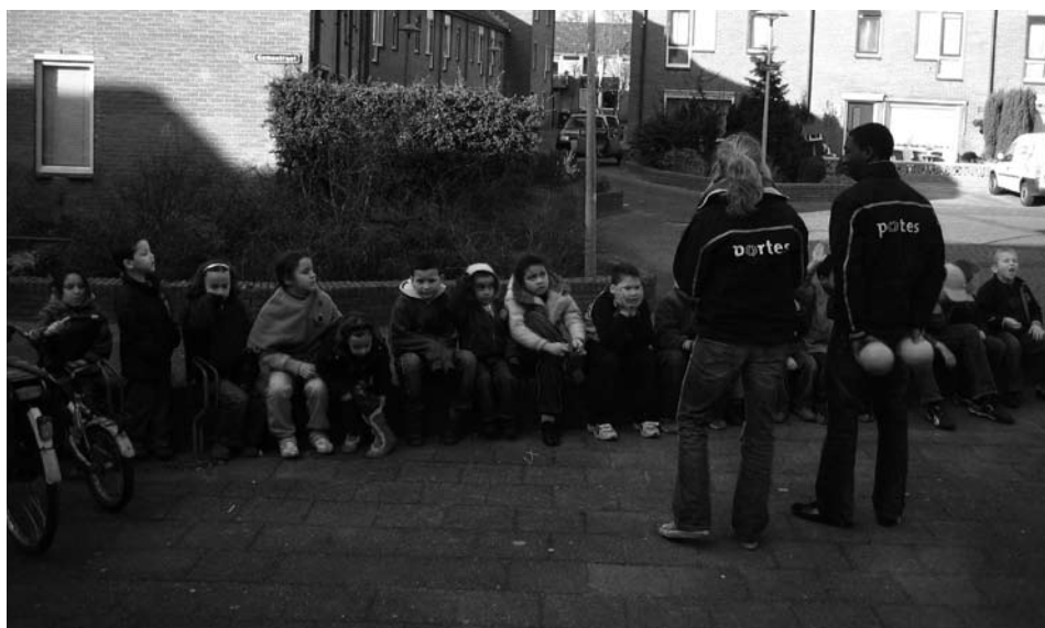
Stagiaires van Portes leggen een spel uit.

Meer weten over Meedoen Op Straat? Kijk op http://www.portes.nl/zuid/actueel/meedoenopstraat.html . (EB)