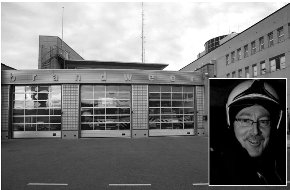
Brandweerpost Tolsteeg en brandweerman Cor.

Een studente die van tientallen waxinelichtjes op de grond een brandend hart maakt en dan even een fles wijn gaat halen of mensen die na een feestje de asbakken leegmaken met een stofzuiger. Als brandweerman in Utrecht maak je heel wat mee, zo blijkt uit de verhalen van Cor Kraaijenhagen, werkzaam bij de post Tolsteeg.