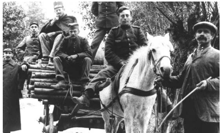
Nederlandse militairen op de Oude Liesboschweg

De Hoogravenscheweg was de hoofdstraat van de buurt. Door het volgen van de Hoogravenscheweg kwam men via de hoge lijnkoekenfabriek van Hooghiemstra en het "zaaltje" (evangelisatiepost Stadszending) bij de steenovens terecht. De steenovens markeerden de grens van Hoograven. Steenoven De Liesbosch was de enige steenoven die niet via de Hoogravenscheweg was te bereiken. Voor deze oven moest je de Vaartserijn volgen, langs een weggetje met hoge bruggetjes. Langs de waterkant lagen de stenen in allerlei soorten in hoge tassen opgestapeld. Achter de stenen lagen de verschillende buurtjes van de "ovengasten", zoals de mensen genoemd werden die bij de ovens werkten. De ovengasten vormden in de buurt van Hoograven een volkje apart, hechte gemeenschappen van harde werkers.