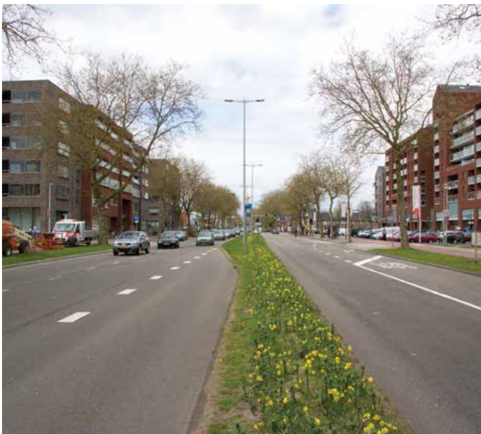
De drukke 't Goylaan moet een groene stadsboulevard worden.

Het vorige college had al ideeën over de 't Goylaan. Dit college is met de plannen verder gegaan en heeft nu het plan dat de 't Goylaan een stadsboulevard wordt. Dat houdt in: één rijstrook per rijrichting met 'stil' asfalt, een brede middenberm met bomen en brede fiets- en voetpaden. Het moet een weg worden, waar een prettig 'verblijfsklimaat' moet zijn. Net als op een boulevard.