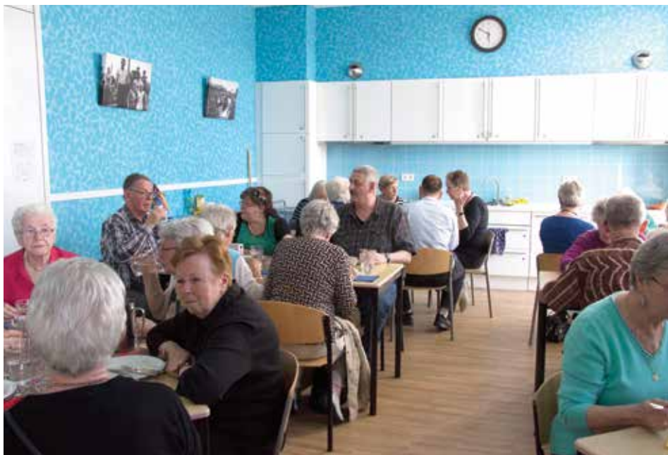
Ravenna's Restaurant is een ontmoetingsplek voor de buurt.

Ravenna zit nu ruim een jaar in Hart van Hoograven, het buurthuis aan de 't Goylaan. Het is opgericht door enkele actieve buurtbewoners rond buurthuis De Barkel. Toen dit buurthuis dicht ging, is Ravenna verhuisd naar de huidige plek. Buurtbewoners kunnen het restaurant op deze centrale plek steeds beter vinden, zo goed