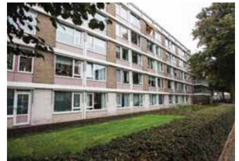
Zorgcentrum Tolsteeg.

Wil je op de hoogte blijven van de activiteiten van de bewonerscommissie of zelf actief worden? Stuur een e-mail naar bewonersgroeptolsteegplantsoen@gmail.com of bezoek de groep op Facebook: www.facebook.com/bewonerscommissie-tolsteegplantsoen . (JJ)