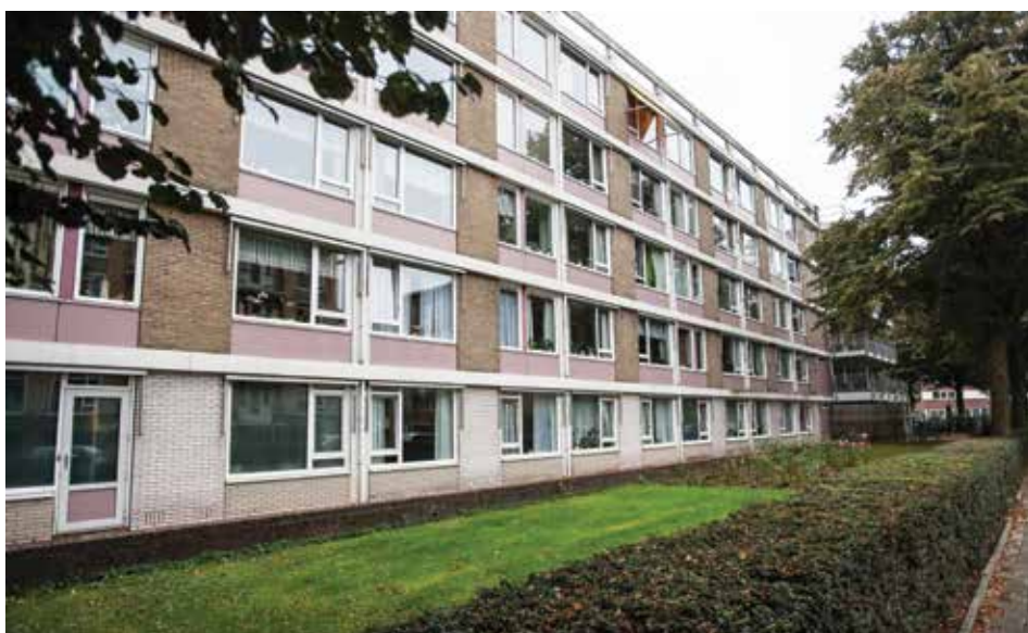
Woonzorgcentrum Tolsteeg.

Studenten en starters op de woningmarkt nemen vanaf eind 2015 langzaam aan hun intrek in appartementen van woonzorgcentrum Tolsteeg. Woningcorporatie Portaal tekende eind augustus een overeenkomst met de Stichting Tijdelijk Wonen (STW Nederland) die het woonzorgcentrum aan de Saffierlaan gaat omvormen tot een jongerenflat. De laatste ouderen verhuizen medio 2016 naar het Veemarktterrein. De bewoners van de 155 aangrenzende aanleunwoningen mogen blijven.