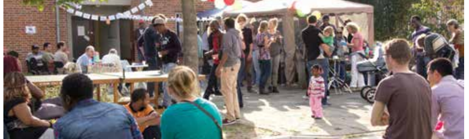
Volop vertier bij Villa Vrede.

Op zaterdag 27 september was het Burendag. Villa Vrede greep die gelegenheid aan om een gezellige middag te organiseren voor de buurt. Het motto: 'Ontmoet een goede buur en een verre vriend'. Villa Vrede is een dagopvang voor mensen zonder verblijfsstatus. Sinds maart is deze gevestigd aan Wijnesteinlaan 4, naast het Marcuscentrum.