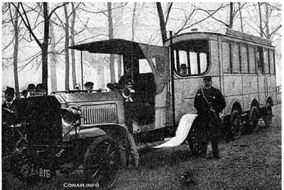
De Renard-trein van 's Gravenhage naar Wassenaar.

Renardtrein was een voorwagen waar een aantal volgwagens voor personenvervoer aangekoppeld waren. Het uit Frankrijk afkomstige vehikel werd in 1905 o.a. in de omgeving van Utrecht, Amersfoort en Alphen a/d Rijn gedemonstreerd en maakte grote indruk. De firma Hillen kreeg vervolgens in oktober 1905 een vergunning om zo'n Renardtrein te bouwen. Of Hillen daadwerkelijk de voorwagen fabriceerde of alleen de volgwagens, is tot op heden onbekend. Het uitbreken van de Eerste Wereldoorlog in 1914 zorgde er uiteindelijk voor dat het hele project een zachte en snelle dood stierf. (RvD)