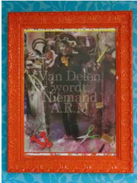
Kringloopcentrum de Arm.