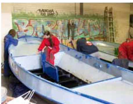
In de wintermaanden staat het onderhoud van de vloot op het programma.