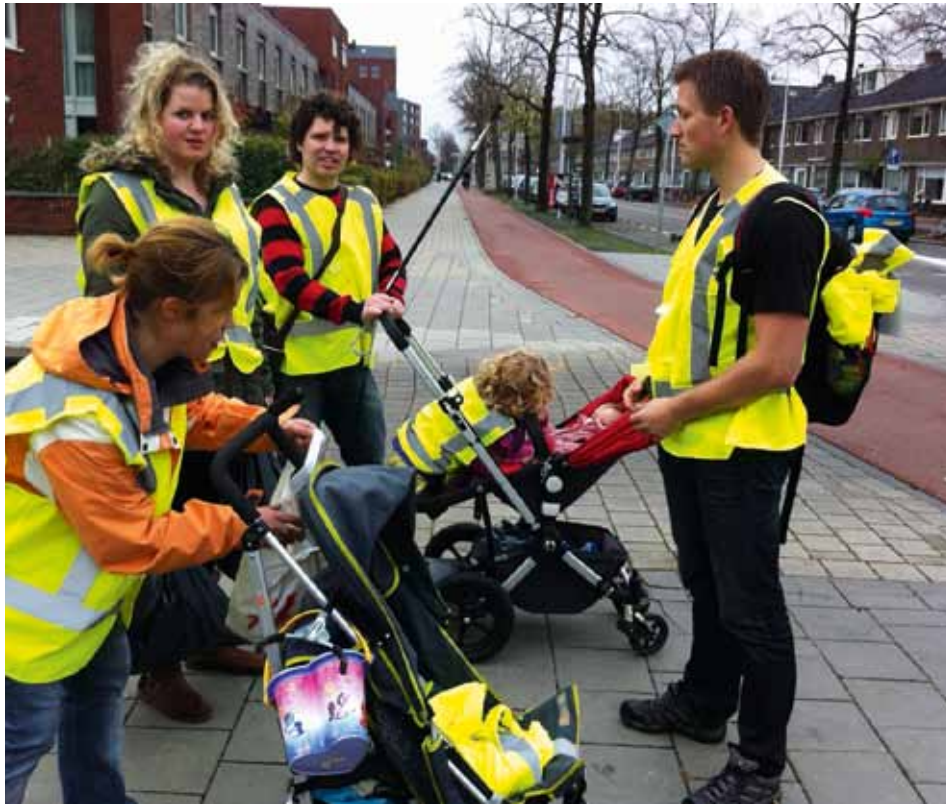
Handen uit de mouwen voor een schoon Hoograven.

Oog voor Hoograven organiseert een lichtjesroute door de wijk. Een prima moment om te zien hoe mooi Hoograven wordt en om met andere wijkbewoners het begin van 2014 te vieren. De optocht is eind januari.