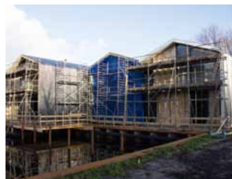
De nieuwbouw in het Liesbosspark.