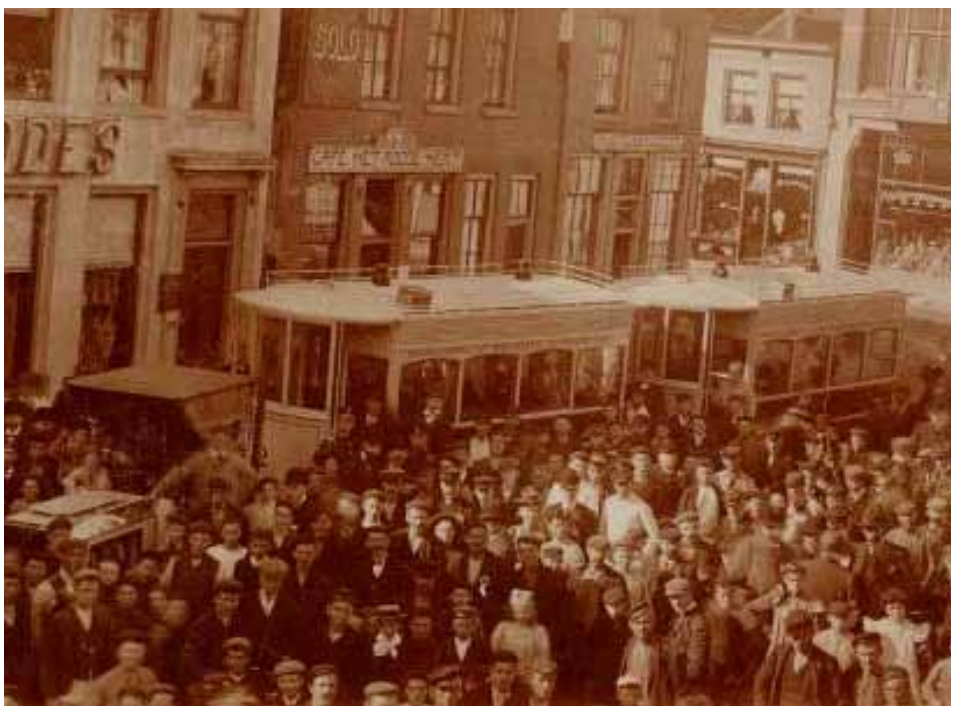
Demonstratie van het voertuig op de Varkensmarkt in Amersfoort.