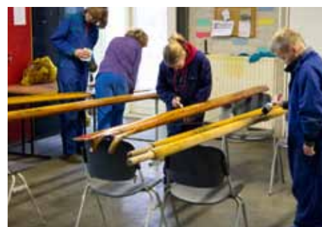
Op de huidige locatie is het nog roeien met de riemen...

Inmiddels is er veel overleg geweest tussen Baracuda Zeeverkeners, welzijnsorganisatie Vooruit, de beheerder van de bouwspeltuin, en Ludens die naschoolse opvang verzorgt in het pand in de speltuin. De partijen hebben elkaar gevonden in een gemeenschappelijke visie op hoe kinderen zouden moeten kunnen spelen. Dit is terug te zien in de herinrichting van de speltuin waarbij ze alle betrokken zijn. Omdat de waterscoutinggroep haar buitenruimte alleen op zaterdag gebruikt, is afgesproken dat op de andere dagen daar ook kinderen uit de speltuin mogen spelen. (WtV)