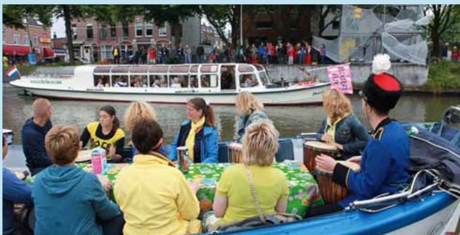
Muzikale botenparade op weg naar Lucasbolwerk.