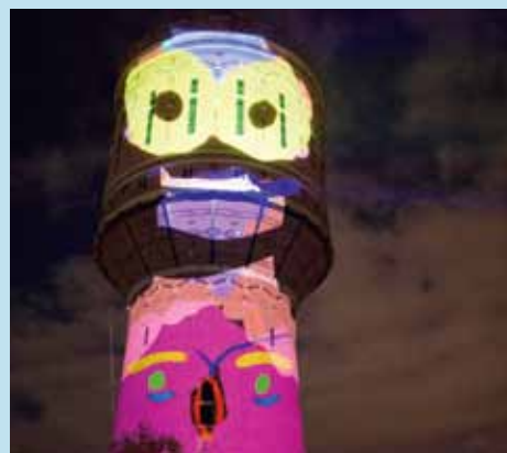
Light up kleurt watertoren.

In het weekend van 21-22-23 juni vond het Festival van de Verbinding plaats. Onder het motto 'Samen Maken, Samen Kijken, Samen Doen, Samen Eten' waren op verschillende plekken in Tolsteeg, Hoograven en Rotsoord allerlei activiteiten te beleven. Wethouder Lintmeijer opende een brug over de Vaartse Rijn, op het voormalige motorclubterrein was een versmarkt, bij kinderboerderij Nieuw Rotsoord kon samen muziek gemaakt en gekampeerd worden en de watertoren kreeg 's nachts een heel ander gezicht. Een fotocollage van een zinderend weekend.