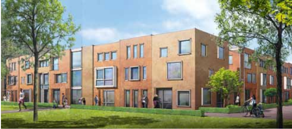
Artist impression van nieuwbouwproject aan Camminghaplantsoen en Duurstedelaan.

De Duurstedelaan in Hoograven-Zuid blijft nog even het terrein van bouwvakkers. In mei is de Brede School opgeleverd en in juni volgde nieuwbouwcomplex De Gravin. Het volgende project is de bouw van vijftien eengezinswoningen. Die komen te staan aan het Camminghaplantsoen en haaks op de Duurstedelaan.