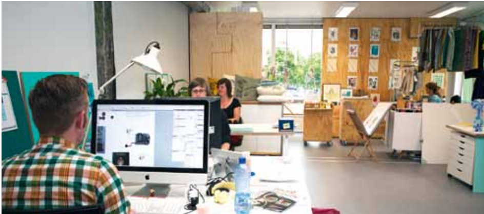
Een blik op de creatieve 1e etage.

Ze zijn ontwerpende ondernemers en kijken in hun studio uit op de bootjes in de Vaartse Rijn en de Watertoren. Lunchen kan beneden bij Café Klein Berlijn. Tien jonge dertigers; grafische vormgevers, illustratoren, styliste, kunstenaar, een webbouwer en concept store Urlaub ( www.totem.nu ) hebben het prima naar hun zin op Briljantlaan 5b. ‘Samen en individueel storten wij ons op creatieve projecten.’