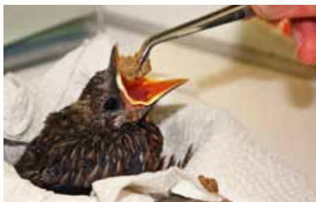
Het voeren van de merels.