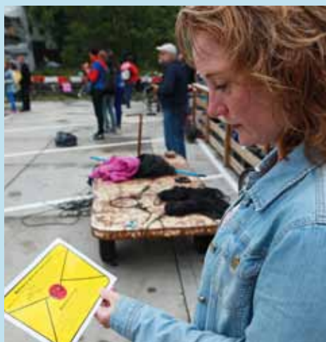
Post van/voor Hoograven/Rivierenwijk.