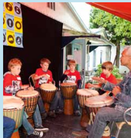
Trommel-clinic bij Nieuw Rotsoord.