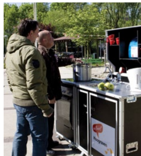
Ook voor de buurtbarbecue.

De keuken bestaat uit een mobiel keukensblok met koelkast, spoelbak en boiler. Enthousiaste koks en kokkinnen kunnen op het meegeleverde kookeiland met maar liefst vijf kookplaten een complete maaltijd bereiden. Wie meer denkt aan een megapizza voor de hele straat, kan zijn lol op met de bijgeleverde oven.