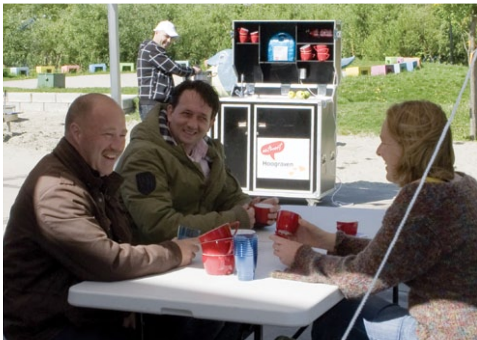
De mobiele keuken staat de hele zomer paraat.

De zomerperiode is het ideale seizoen voor een straatfeest, open dag, werk-lunch, themamiddag of relatieborrel in de openlucht. Speciaal voor deze gelegenheden is er de mobiele keuken, die letterlijk en figuurlijk een 'Briljant idee' is uit het wijkactieplan Hoograven in de lift.