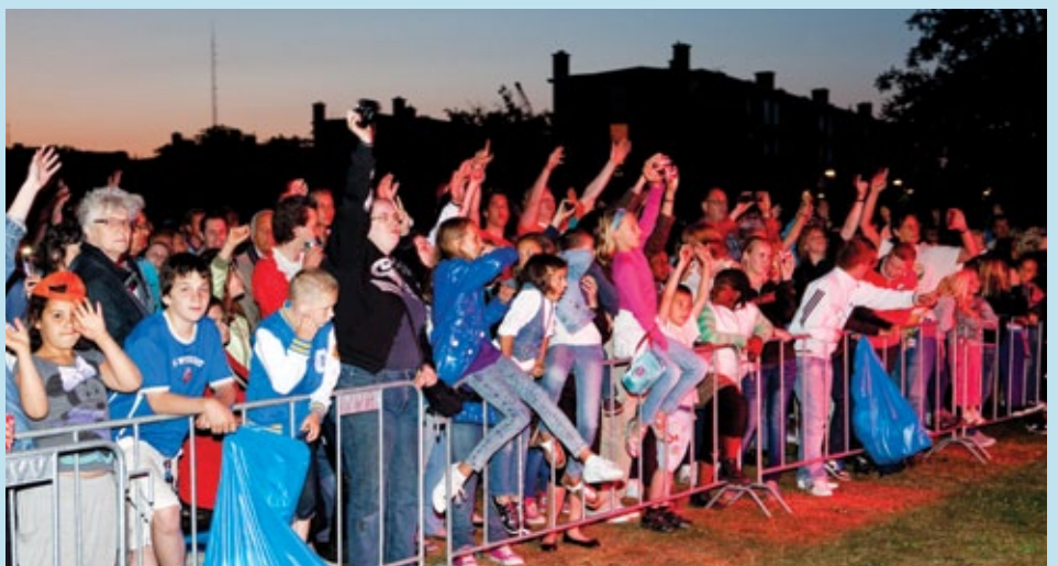
We want more!