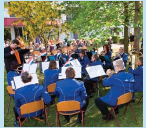
Orkest KUDO zet de toon.