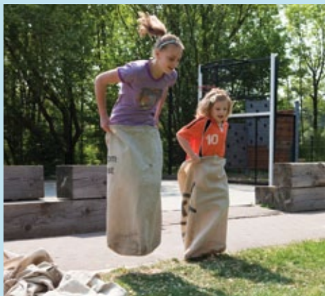
Zaklopen in de speeltuin.