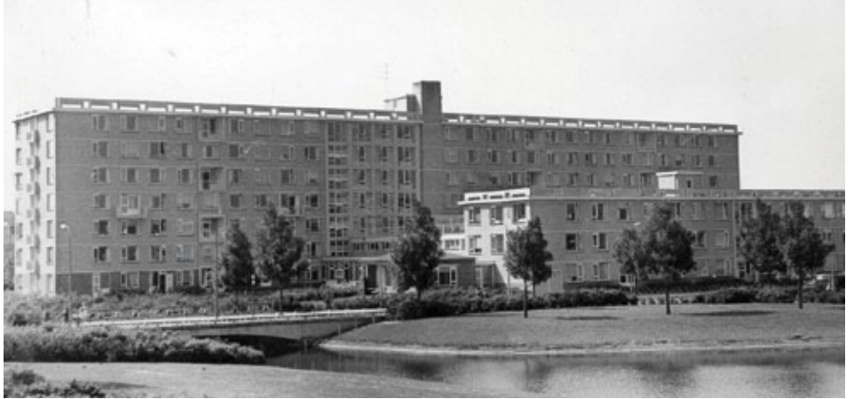
Het Ariënhuis.

Op 26 april 1962, de geboortedag van Alphons Ariëns, wordt een koker in de grond gestopt met daarin de oorkonde waarop op traditionele wijze de startdatum wordt aangeduid. De eerste steen wordt gelegd door de weduwe van P.H. de Vink, een man die zich bijzonder heeft ingespannen voor de totstandkoming van het tehuis. Het huis wordt op 12 februari 1964 ingezegend door de Aartsbisschop, waarna de eerste bewoners hun intrek nemen. Uiteindelijk biedt het Ariënhuis plaats aan 300 bewoners, die voor een deel intern wonen en voor een deel in aanleunwoningen.