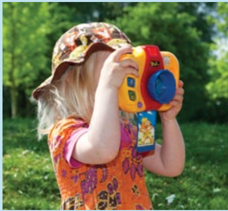
Ted kiest kiekend meisje.

Een stralende oranjezon zorgde voor een kleurrijke en gezellige Koninginnedag in Hoograven, Tolsteeg en Bokkenbuurt. Op verschillende plekken in de wijk is de verjaardag van de koningin gevierd met muziek, oudhollandse spelletjes, oranjebitter én vuurwerk! Fotograaf Ted van Arnhem legde de festiviteit en vast. (ER)