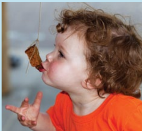
Koekhappen: altijd prijs.