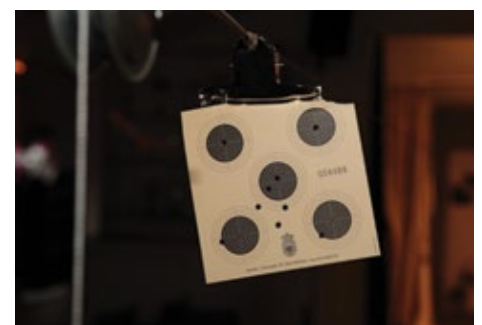
In de roos!