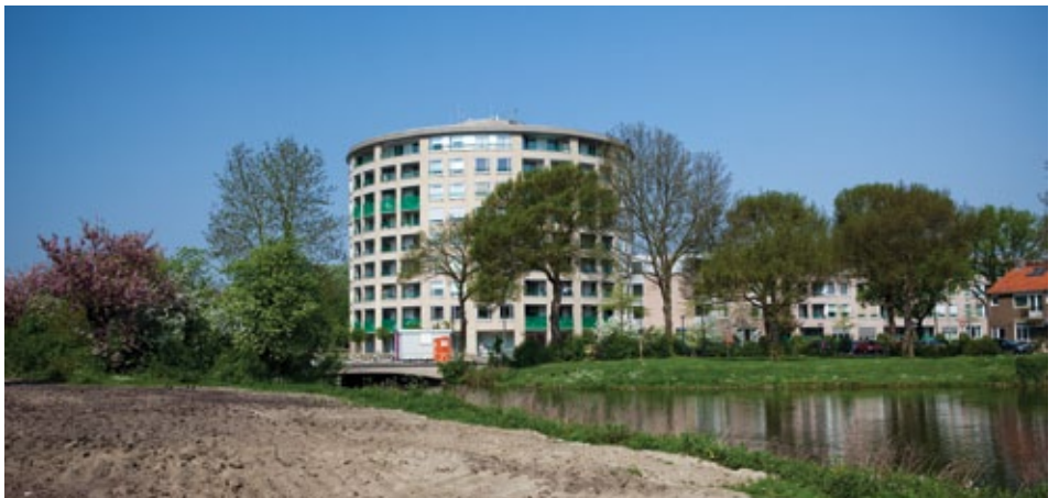
Nieuw Plettenburgh anno nu.