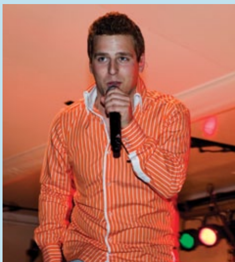
Popstar Wesley Klein sluit de dag af.