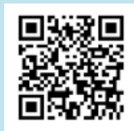
Website USC De Tol.

Bezoek de website of bekijk de video door met uw smartphone of tablet onderstaande QR-codes te scannen.