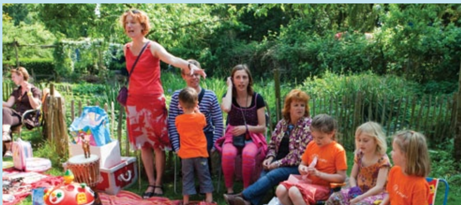
Kindervrijmarkt op Nieuw Rotsoord. De opbrengst wordt eerlijk verdeeld.