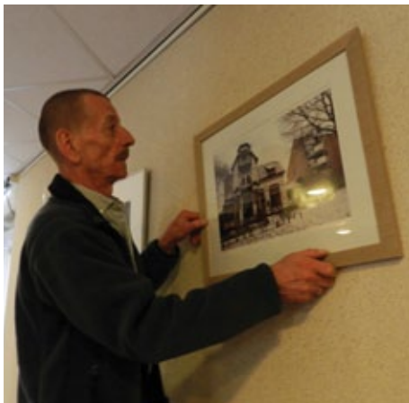
De huismeester van Plettenburgh.

Wijkkrant Aanzet organiseerde eind vorig jaar de verkiezing van het mooiste gebouw van Hoograven, Tolsteeg en Bokkenbuurt. De prachtige villa aan de Vaartse Rijn, beter bekend als Villa Kakelbont, won. Namens Wijkbureau Zuid ontving de Aanzetredactie een mooie ingelijste foto van het pand. Kortgeleden is deze foto officieel overhandigd aan Woonzorgcentrum Nieuw Plettenburgh, zodat ook minder mobiele bewoners Villa Kakelbont kunnen bekijken. Met hulp van de huismeester is de villa nu te bewonderen in de entree van het seniorencomplex. (ER)