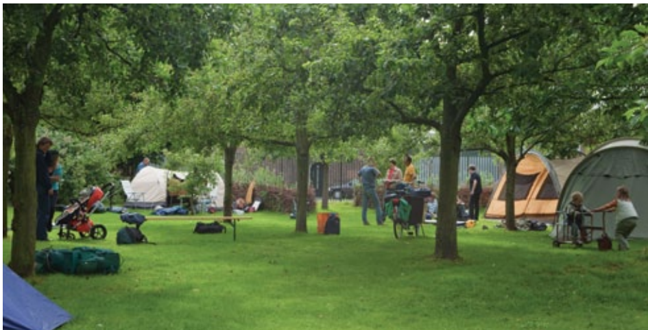
Het Midzomernachtfeest was vorig jaar een groot succes.

Nog even en dan is het de langste dag en de kortste nacht van het jaar. In landen als Engeland, Noorwegen en Litouwen is dit reden voor een feest en ook in Utrecht-Zuid gaat dit moment niet ongemerkt voorbij. Op dierenweide Nieuw Rotsoord en in de watertoren aan het Heuveloord wordt op zaterdag 18 juni het Midzomernachtfeest gevierd. Het programma begint om 19.00 uur. Voor de bezoekers is er een workshop sieraden maken met materiaal uit de tuin, een vleurmuizenexcursie en speciaal voor kinderen workshops theater, fotografie en licht. Ook zijn er diverse optredens, worden er liederen ten gehore gebracht bij het kampvuur en kun je 'kamperen bij de boer'. Voor dat laatste moet je je van tevoren aanmelden. Tenten kunnen vanaf 17.00 uur worden opgezet. Behalve