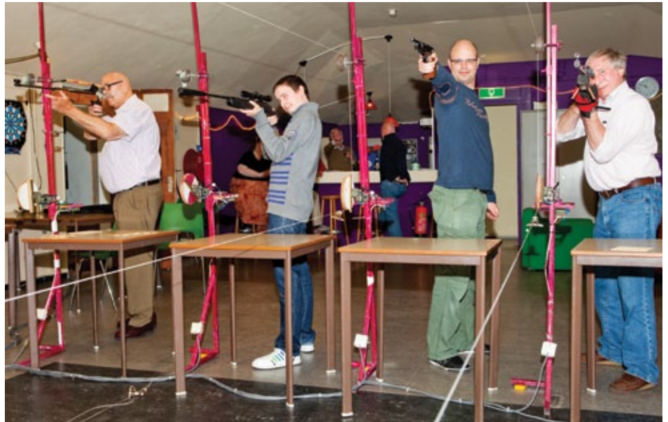
De leden van de schietclub komen wekelijks bij elkaar.

Langs wit bebloesemde bomen in de Jan van Arkelstraat leidt een lenteavondwandeling naar de momenteel dertien leden tellende schietclub USC De Tol op nummer 55.