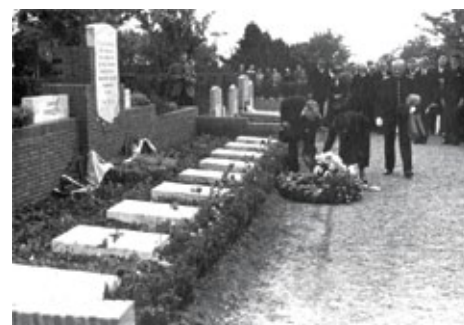
Onthulling monument Oranje Vrijbuiters, 10 mei 1947.

De openingstijden van de begraafplaats zijn vrijdag t/m zaterdag van 8.00 tot 20.00 uur en op zon- en feestdagen van 10.00 tot 20.00 uur. Voor meer algemene informatie: 030-2863992.