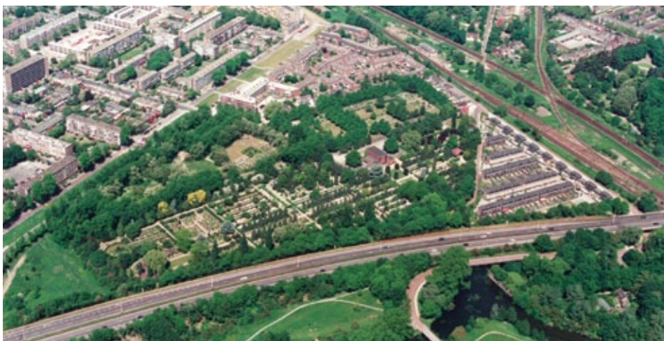
Begraafplaats Tolsteeg.

Op het begrafenisterrein bevinden zich verder twee monumenten met Nederlandse oorlogsgraven. Het 'Monument voor de Binnenlandse Strijdkrachten' is opgericht ter nagedachtenis aan de twaalf