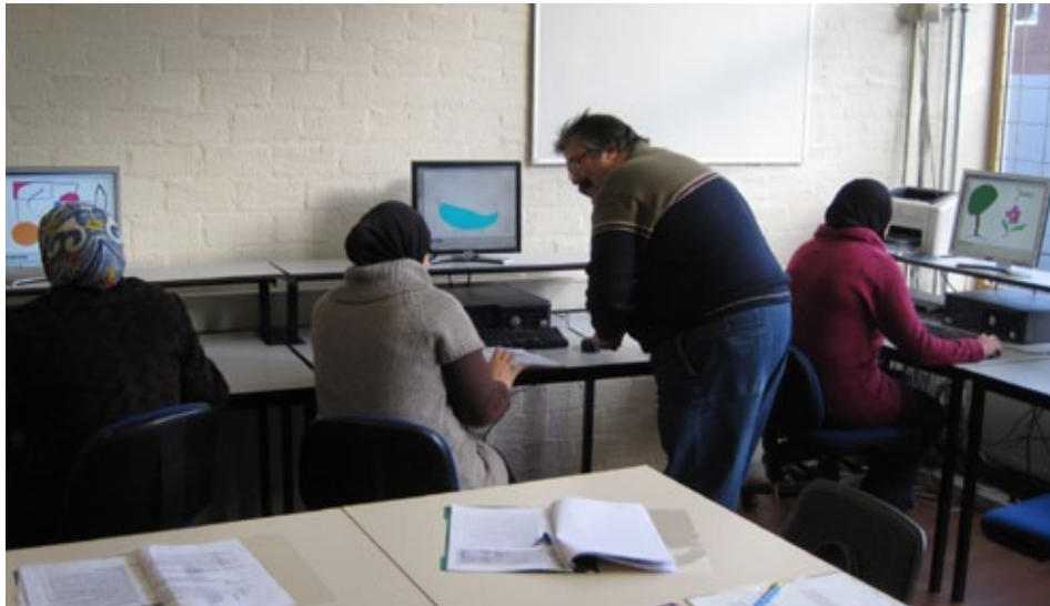
Computerlessen in De Tol.

'Ik ben blij dat ik dit heb gedaan en ik voel me nu actiever omdat ik nu nieuwe dingen doe. Ik krijg er energie van!' Aan het woord is een Marokkaanse moeder (35) van 4 kinderen, die vroeger in Marokko én Spanje heeft gewoond. Een kennis stimuleerde haar om iets 'buiten de deur' te ondernemen. Bovendien vond ze ooit een folder van het 'Activeringsteam Hoograven' in de schooltas van één van haar kinderen.