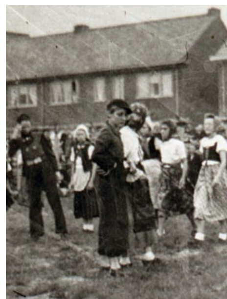
Koninginnedag 1952.