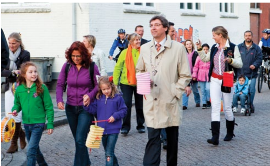
De lampionnoptocht op Koninginnedag, aangevoerd door de burgemeester.