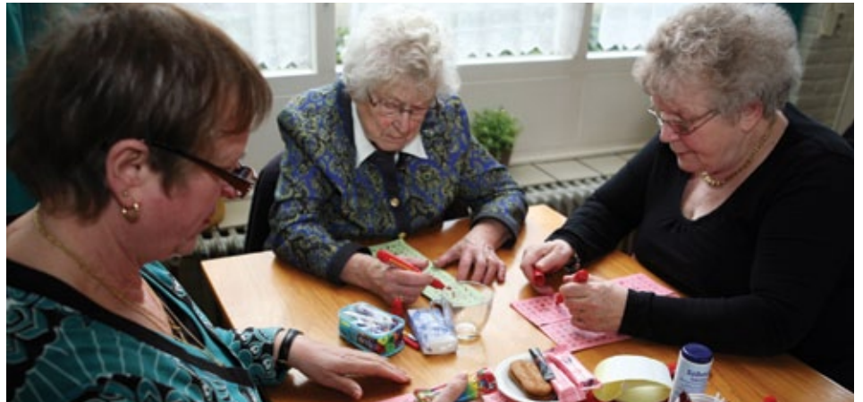
Dames concentreren zich op de bingokaart.

‘Otto 69’, roept Antoinette onverstoorbaar, of ‘Isaak 21, Gerard 50’, bij elk balletje dat ze uit haar ‘knikkerzakje’ grabbelt, ‘Bernard 10!’