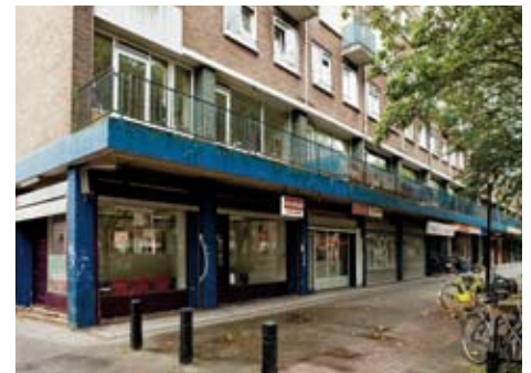
Het oude complex wordt in 2010 gesloopt.

Wij houden u uiteraard op de hoogte van de ontwikkelingen van de zuidzijde van de 't Goylaan. (EB)