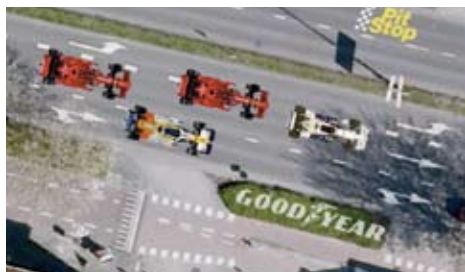
De toekomst van de 't Goylaan?

Dat de kloof tussen politiek en (een deel van) de burgers helemaal zo groot niet is, blijkt dinsdag 15 september in Wijkbureau Zuid. Het werkbezoek van een achttal gemeenteraadsleden en een wethouder aan Hoograven doet ruim vijftig mensen besluiten af te reizen naar het gebouw aan de 't Goylaan, alwaar een aantal heikele kwesties wordt besproken.