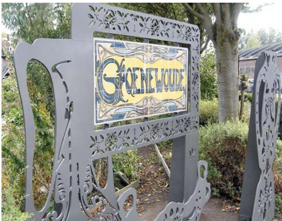
Een van de projecten bekostigd uit het leefbaarheidsbudget: de historische route, verzorgd door de HKTH.

Ook bij de huidige expositie kunnen bewoners een grote rol spelen: de getoonde ontwerpen zijn nog niet voltooid. Hooimeijer: 'Mensen kunnen meteen bij de diverse ontwerpen aangeven wat ze er van vinden, hoe het anders zou kunnen en welke suggesties ze zelf nog meer hebben, een interactieve tentoonstelling dus. Je kunt je eigen wijk vorm geven.' De expositie loopt de hele maand in de Toonkamer bij meubelfabriek Pastoe, Rotsoord 3, de toegang is gratis. (RvD)