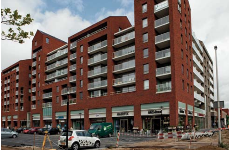
Het nieuwe winkel- en wooncomplex.

In de zomer zijn de eerste winkels van het nieuwe winkelcentrum Hart van Hoograven geopend. Nog niet alles is gereed. Maar de eerste aanzet is er. Wat vinden de winkeliers er zelf van en wanneer gaat men beginnen aan de zuidzijde van de 't Goylaan?