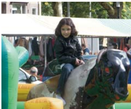
Dappere dodo op een woeste stier.

Het Tolsteegplantsoen was zaterdag 12 september weer een mooie vrijmarkt- en braderielocatie van de jaarlijkse 'Happening Hoograven'. Terwijl het najaarszon-