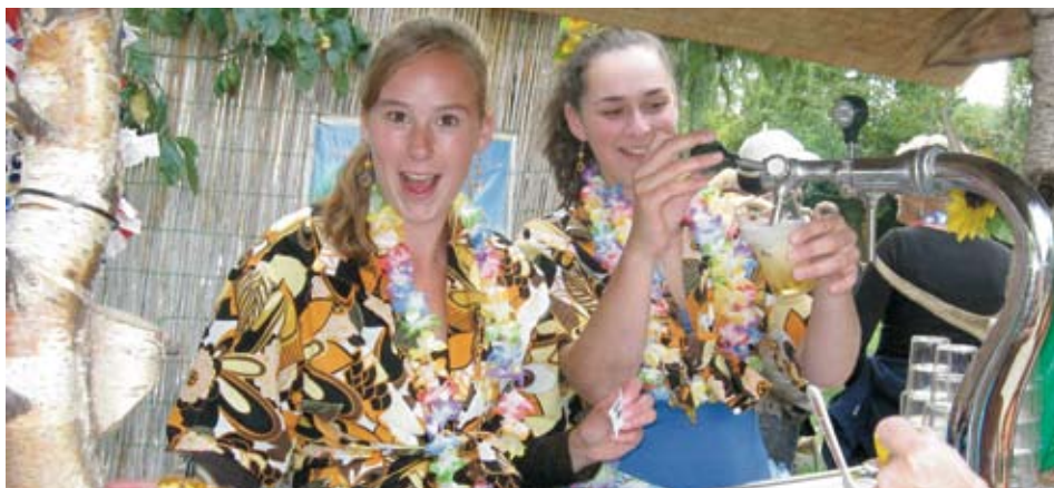
Een koud biertje mag bij een beetje lustrumfeest niet ontbreken.

Alleen de geiten en schapen in de wei deden wat ze elke dag doen: gras grazen... (HvD en HDR)