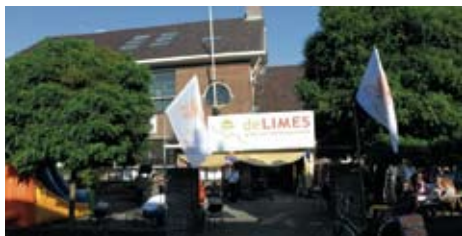
De Limes was het thema van het straatfeest op de Verlengde Hoogravenseweg.

Tot ongeveer anderhalf jaar geleden ging men er vanuit dat de Romeinse weg door het centrum van Utrecht liep. Onder het huidige Domplein zijn immers al tachtig jaar geleden resten van een grote Romeinse legerplaats gevonden. Met de graaf- en bouwwerkzaamheden in Leidsche Rijn kwam men er achter dat de grensweg, die de verbinding vormde tussen de forten van De Meern, Utrecht en Vechten, veel zuidelijker heeft gelegen. De weg bleek van oost naar west, midden door Hoograven te hebben gelopen.