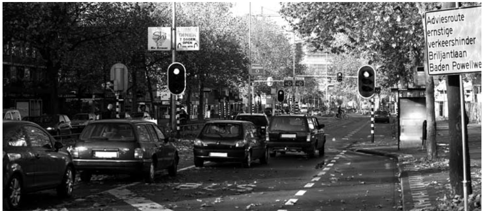
Een dagelijks terugkerend beeld op de 't Goylaan: lange rijen wachtende auto's.

Het valt tegenwoordig niet mee om met de auto Hoograven binnen te komen. Allereerst is het spoorviaduct bij de Albatrosstraat afgesloten vanwege de verplaatsing van een rioolgemaal. Iets verderop is de Diamantweg afgesloten omdat het wegdek wordt gerenoveerd en bij de 't Goylaan staan elke dag lange files, maar dan zonder duidelijke oorzaak: er zijn geen werkwerkzaamheden en de verkeerslichten doen het allemaal. Vreemd genoeg ligt in dit laatste punt misschien wel de reden van alle vertraging.