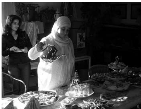
Lekkere hapjes bij de Nieuwjaarsduik.