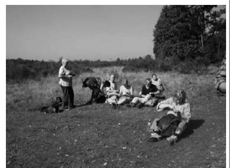
Het Nivon organiseert onder andere wandelingen in de natuur.