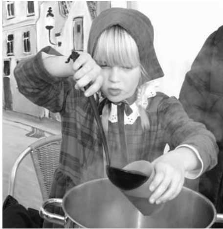
Een glas glühwein bij de kerst Inn.

Op zondag 4 januari 2009 vindt op Rotsoord de Nieuwjaarsduik plaats. Het thema van de Nieuwjaarsduik is Nieuwe Buren, met verhalen van mensen uit verschillende culturen, een workshop koken (mensen van verschillende afkomst leren elkaar hapjes uit hun cultuur te maken, deze hapjes worden later natuurlijk aan de bezoekers aangeboden), trommelen in de openbare ruimte, een theaterworkshop voor kinderen met als thema nieuwe buren, Marokkaans theehuis, de tentoonstelling "kunst bij de buren", verder natuurlijk muziek uit verschillende culturen. Al deze activiteiten gaan plaatsvinden op Kinderboerderij Nieuw Rotsoord en bij de Toonzalen bij Pastoe. Deze dag wordt georganiseerd in samenwerking met Rotsoord Nu, Deisign van Ondix, Nico van Asdonck en Hanneke de Reus. (EB)