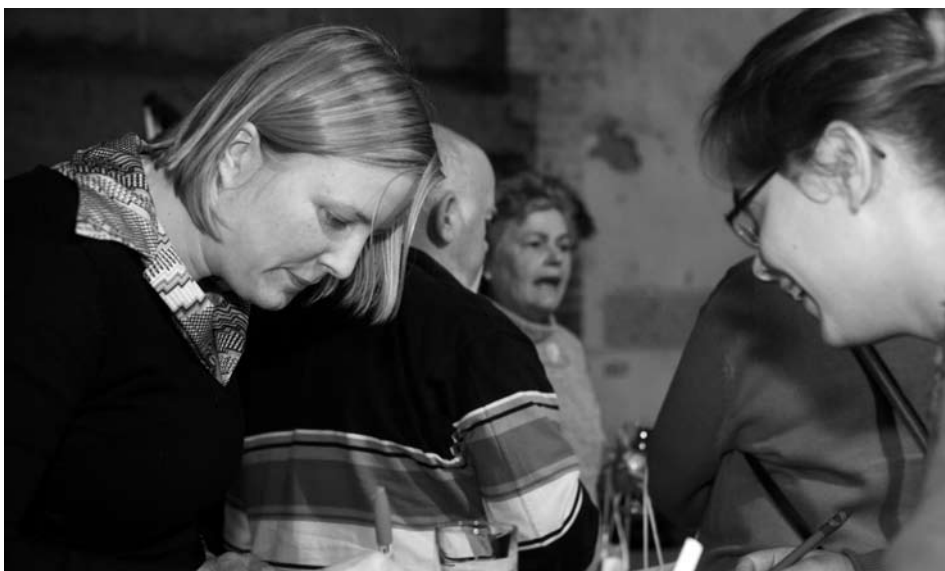
Bezoekers druk bezig met de Briljante ideeën.