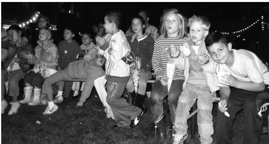
Geen filmvoorstelling is compleet zonder popcorn!