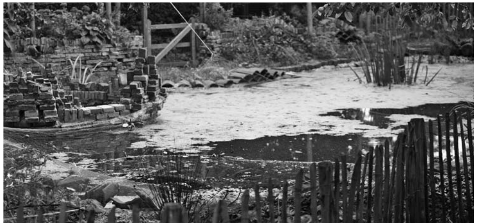
Een unieke eendenvijver: de enige in Nederland die helemaal op natuurlijke wijze wordt gefilterd.