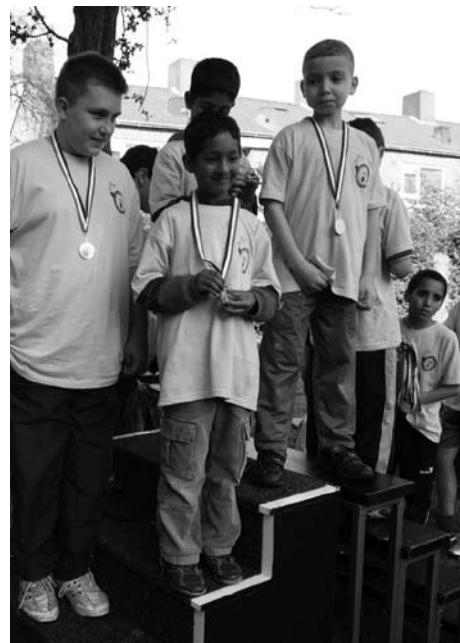
De winnaars van het voetbaltoernooi.