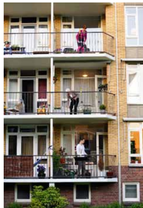
Voorstelling House in Tolsteeg.