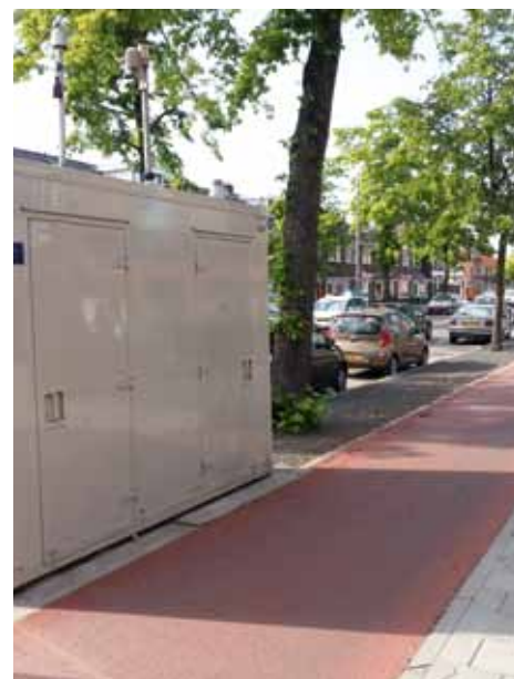
Meetopstelling aan de Constant Erzeijstraat.

Alle gegevens van het LML zijn te downloaden van de website, www.lml.rivm.nl . Op de site van het RIVM zijn de ook jaaroverzichten te vinden met meetdata en trends voor Nederland, www.rivm.nl/Bibliotheek . (JA)