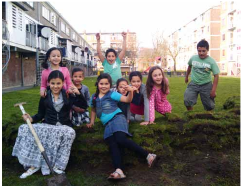
Kinderen helpen in de Buurtmoestuin.