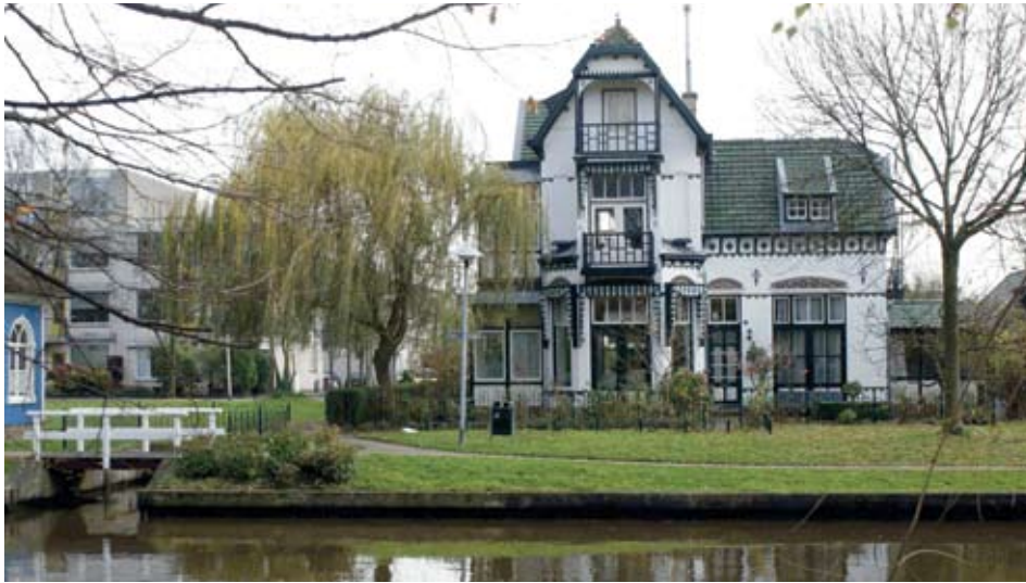
'Villa Kakelbont' is volgens de meeste inzenders het mooiste gebouw van Hoograven

De Pastoefabriek werd genoemd, net als de Essalaam Moskee en het nieuwe appartementencomplex 'De Steenhouwer' aan de Briljantlaan. Het zijn echter slechts eervolle vermeldingen in de uitslag van de in het vorige nummer aangekondigde verkiezing 'Het mooiste gebouw van Hoograven'.