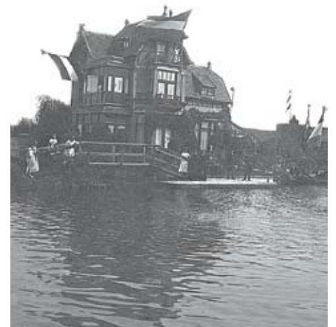
De villa is in 1904 gebouwd

In tegenstelling tot wat veel wandelaars waarschijnlijk denken, behoort het theehuisje dat langs het wandelpad staat niet tot de villa. Het is eigendom van de gemeente en werd, nadat het uitgebreid is gerestaureerd, in 1989 naar zijn huidige plek gebracht. Momenteel fungeert het huisje als atelier voor een kunstenaar uit Bilthoven. (RvD)