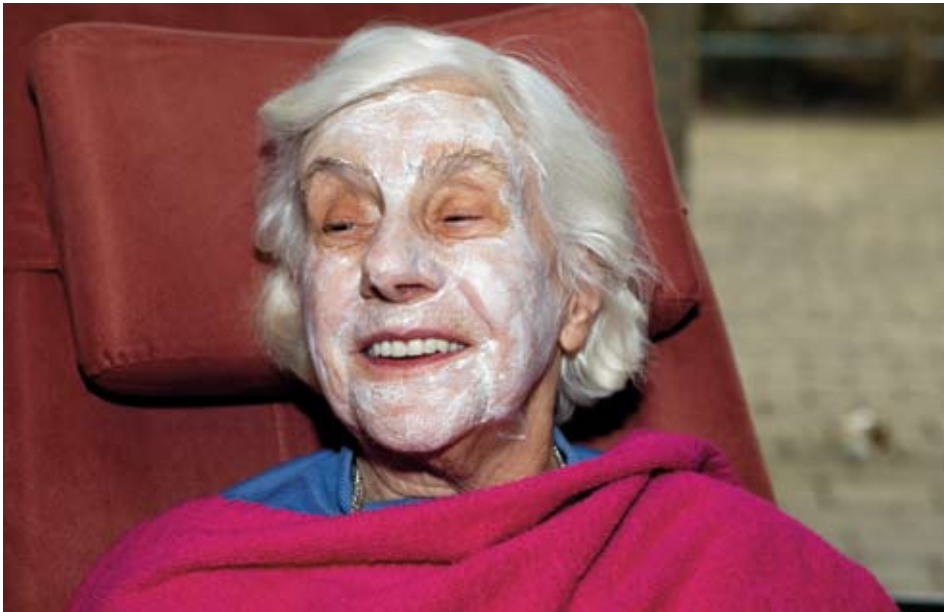
Een van de dames ontspant zich met een gezichtsmasker

Bezoekers van de Dagverzorging in Plettenburgh werden op zaterdag 20 november in de watten gelegd door een groep vrijwilligers van een uitzendbureau. Een uitzendbureau dat zich richt op de zorg en één keer per jaar iets wil terug doen voor deze sector. En dat is gelukt.