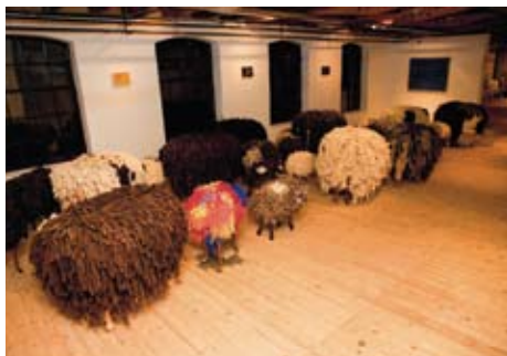
Schapen tentoongesteld in De Pastoefabriek

Zaterdag 13 november kon iedereen met kapotte en gevlekte wollen kleding aanschuiven bij Woolfiller. Daar leerde zij een unieke techniek om de gekwetste kleding weer een nieuw creatief leven in te blazen. Indrukwekkend was de tentoonstelling met een kudde van ruim vijftig kleurrijke kunstschapen: in gedachten hoorde je ze blaten. Gezien het succes van dit initiatief, wordt overwogen om het volgend jaar te herhalen. (HdR)