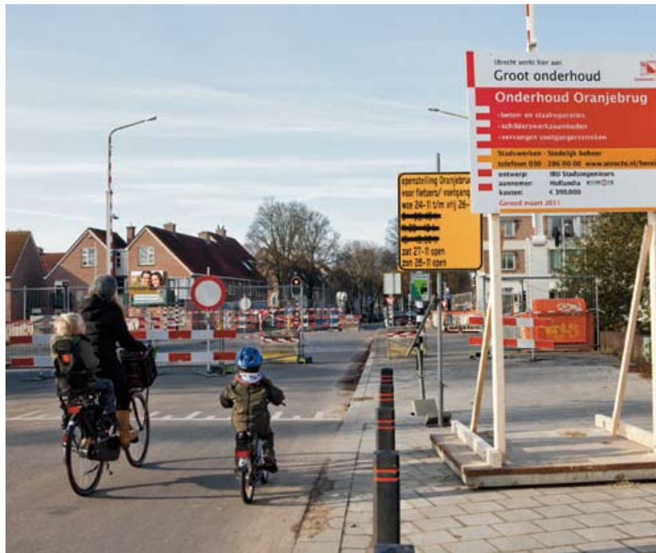
De Oranjebrug is tot en met maart afgesloten

omwonenden en plaatselijke ondernemers in het verkeerde keelgat. De brug vormt immers een belangrijke verbinding met het Smaragdplein. Vooral voor ouderen