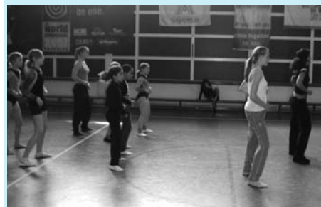
Clipdancers in actie.

Kijk voor meer informatie over Longa en over deelname aan het project Meedoen Allochtone Jeugd door Sport op www.longa-utrecht.nl . (EB)