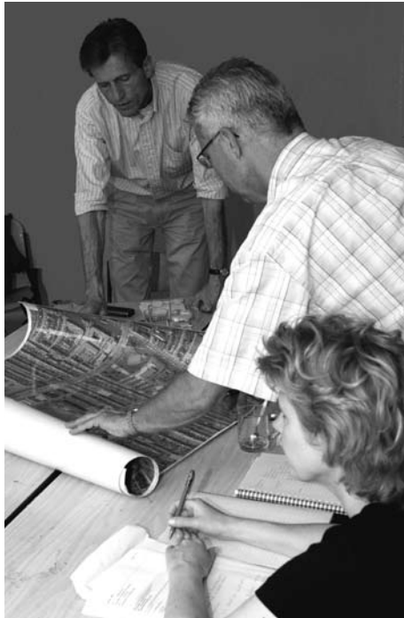
Het buurtpanel buigt zich over de wijk.

Een delegatie van de gemeente reist alle buurten van Utrecht af. In jeugdhonken, bibliotheken en schoolgebouwen biedt ze een luisterend oor aan de klachten van inwoners.