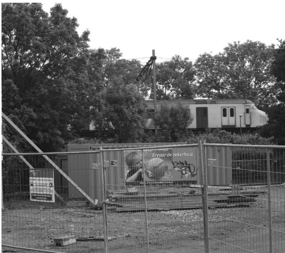
De bouw van het nieuwe rioolgemaal is gestart.

Dossier Randstadspoor op aanzetnet.nl – Op de website van Aanzet zullen we de komende 7 jaar (!) informatie van de verschillende partijen verzamelen. Zo zijn hier momenteel een aantal videobestanden met een 3D voorstelling van het nog te bouwen station te bekijken. Ook vindt u hier meer informatie over de inspraakprocedure en kunt u reageren op de artikelen.