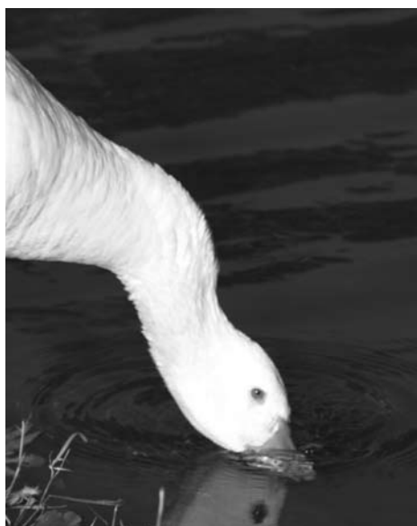
Eten en drinken is er in overvloed.

Het voorjaar in Hoograven was anders dan voorheen: er waren geen jonge gansjes en de groep volwassen ganzen was veel kleiner geworden. Vanwege overlast zijn ruim honderd ganzen gevangen, om ze vervolgens aan particulieren te verkopen.