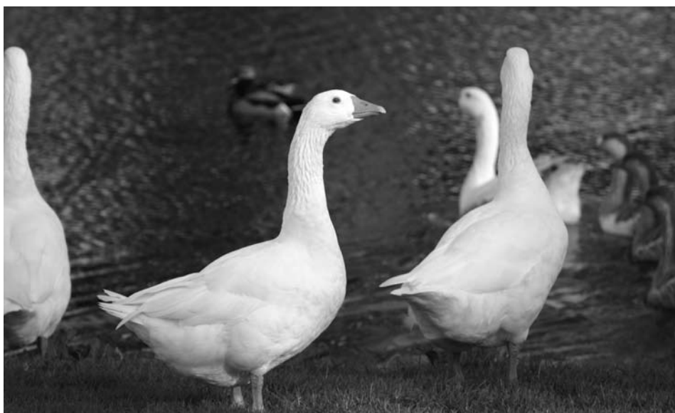
De overgebleven ganzen kiezen het ruime sop.