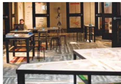
Panelen vol ruige ideeën.

Overigens hadden studenten een romantische oplossing bedacht voor ‘t Goylaan: auto’s dienen ter hoogte van de Schonauwensingel en de Linschotensingel over een bol bruggetje te rijden, waardoor men in de toekomst, onder die brug, gezellig kan wandelen, hardlopen en elkander ontmoeten langs de knusse oevers van het water.. (HvD)