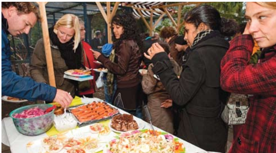
Hoograven viel duidelijk in de smaak.

Het kan menigeen niet ontgaan zijn: zaterdag 3 oktober stond onze wijk in het teken van “Hoograven valt in de Smaak”. Iedereen kon meedoen aan een veelzijdige activiteitenmarathon rondom de thema’s Romeinen en Samen Smakelijk Genieten.