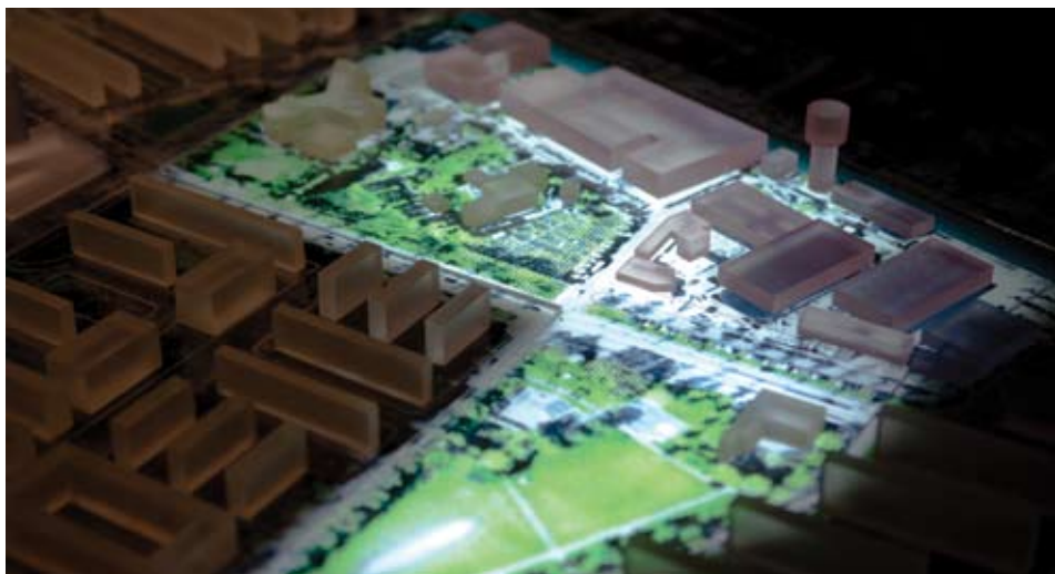
Een onorthodoxe blik op Hoograven.

‘Een Andere Kijk op Hoograven’ heette de tentoonstelling onlangs in de Pastoefabriek. Maatschappelijk verantwoorde stedelijke vormgeving ofwel in jargon: Social Urban Design vierde een maand hoogtij op deze expo. Dat zag er soms heftig uit..