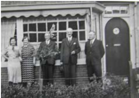
Plakband op de ramen tegen bomschade.

Mede dankzij de interviews is weer een aantal opzienbarende feiten (opnieuw) bekend geworden. Zo moesten van de Duitsers diverse 'Oranjegetinte' straatnamen worden gewijzigd, wat o.a. betekende dat de Julianaweg veranderde in 'Laan 1942'. Verder mocht er 's avonds geen verlichting meer te zien zijn, omdat Engelse bommenwerpers dit als baken op weg naar Duitsland (heen) dan wel Engeland (terug) konden gebruiken. Dit leidde tot witgeschilderde bomen langs de Jutfaseweg, zodat het verkeer tenminste niet in de Vaartsche Rijn belandde. Omdat er, zeker in de laatste oorlogsjaren, een chronisch gebrek aan brandstof was, verdwenen de bomen echter een voor een in diverse kachel. Of dit gevolgen had voor de verkeersveiligheid is niet bekend.