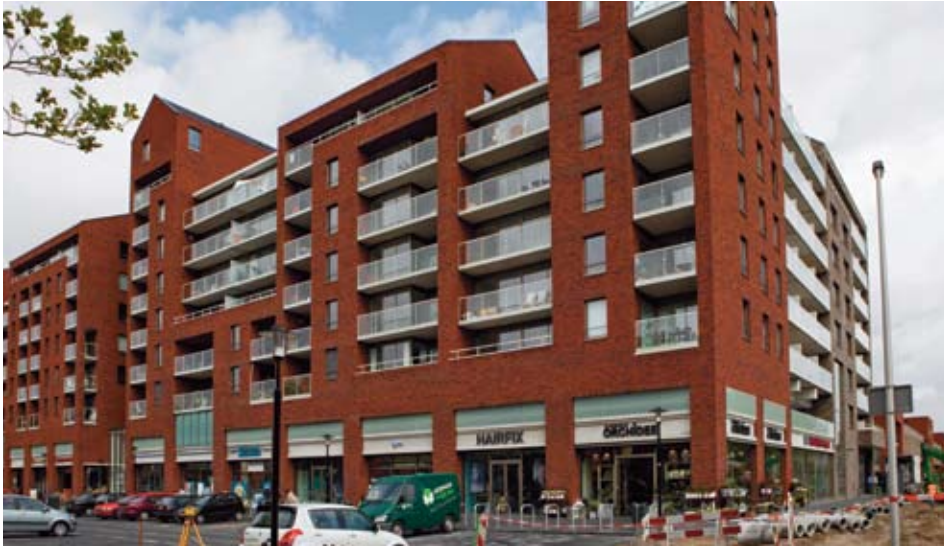
Het nieuwe winkel- en wooncomplex.

Op woensdag 30 september werd het winkelcentrum Hart van Hoograven officieel geopend. De nieuwbouw moet Utrecht Zuid nieuw elan geven. Een maand later, op zomaar een maandagavond, peilden we de meningen.