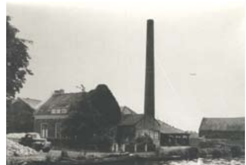
Geallieerde tank in de Verl. Hoogravenseweg.